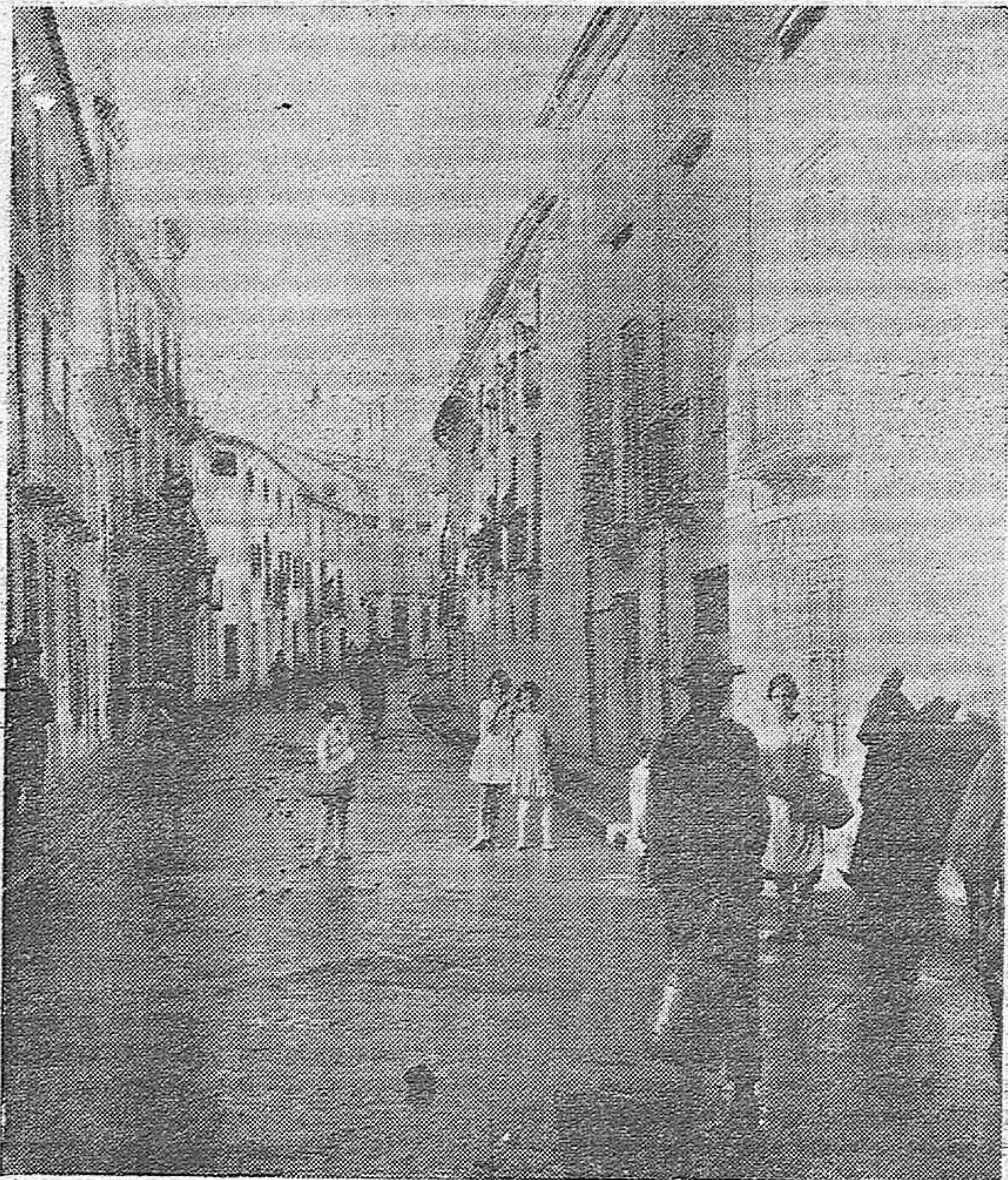
PRIEGO DE CORDOBA.—CALLE OBISPO PÉREZ MUÑOZ. LA PAVIMENTACIÓN DE ESTA CALLE SE HIZO EL AÑO 1929 LLEVA LA CALZADA DE ADUQUÍN SENTADO SOBRE FIRME DE HORMIGÓN Y LAS ACERAS DE BALDOSAS DE CEMENTO

Madrid (con el presidente general de la Adoración Nacional Española, don Manuel Orueta), la de Córdoba (a cuyo frente venía don Pedro Zapatero), y las de Cádiz, Tarifa, Montilla, Cabra, Alcalá la Real, Dos Torres, Carcabuey, etc., etc.