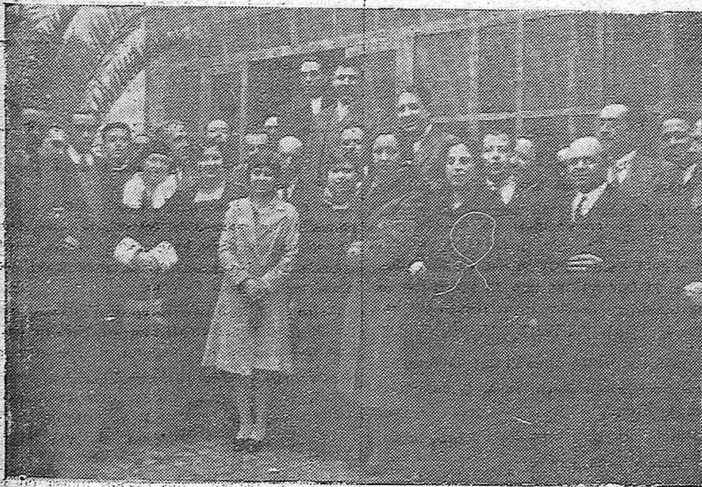
MONTILLA.—El popular novelista José María Carretero "El Caballero Audaz", rodeado de sus familiares y amigos, después del vino de honor con que fué obsequiado en el Casino Montillano