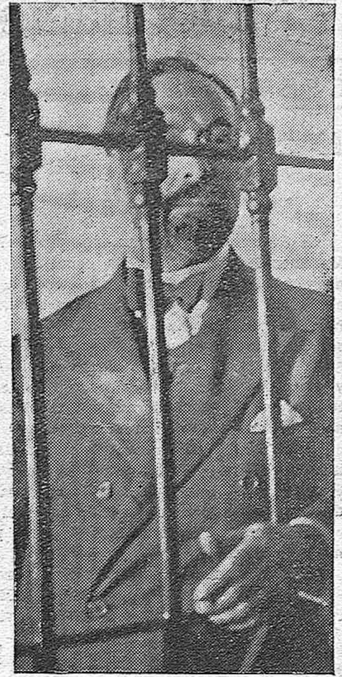
DON FERNANDO DE LOS RÍOS , procesado como firmante del manifiesto revolucionario y para el que se solicita la pena de doce años de prisión.

—Muchas gracias por su indicación ahora mismo voy a dárselo a componer.