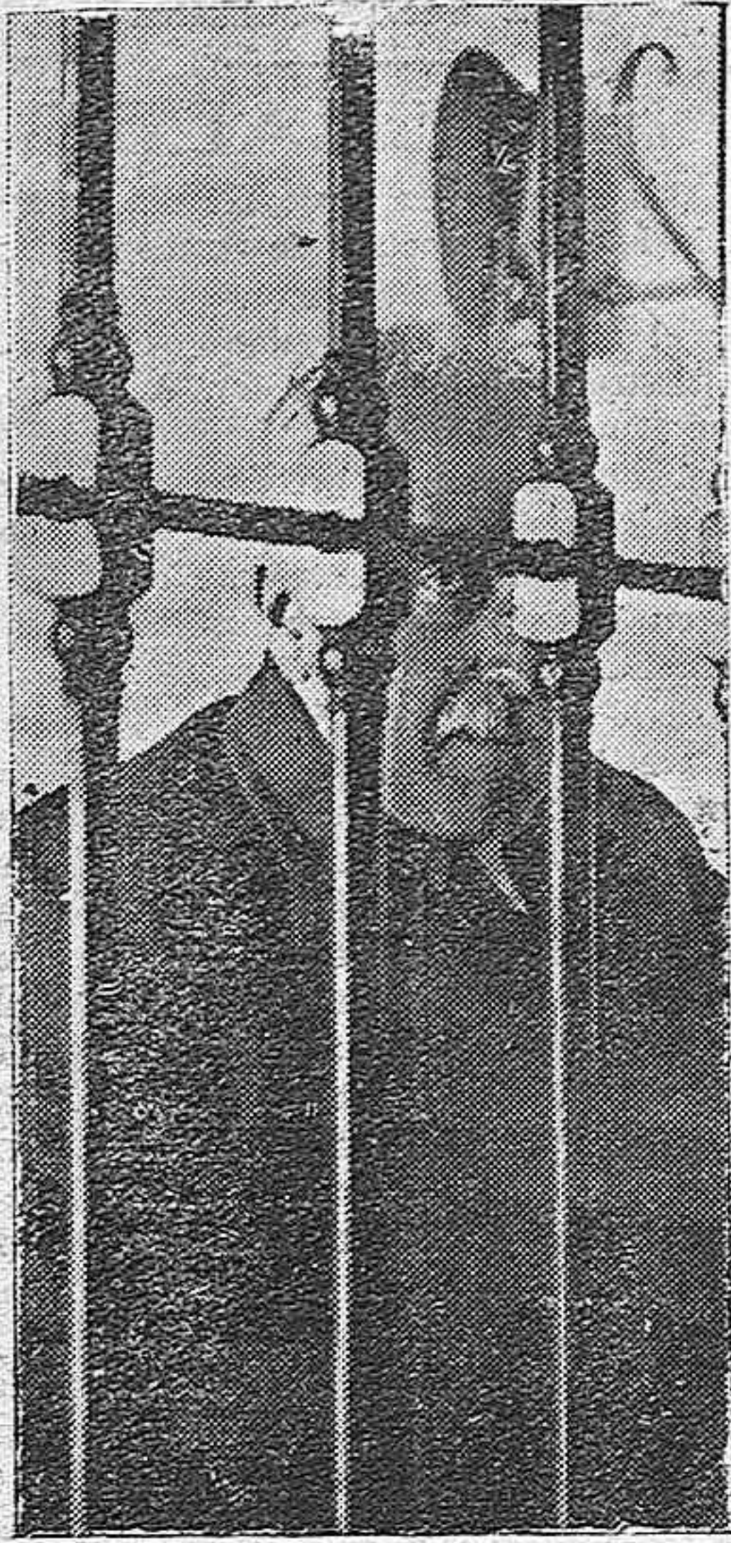
DON NICETO ALCALÁ ZAMORA , uno de los procesados en la causa cuya vista se celebra en Madrid y para el que el fiscal solicita la pena de quince años de prisión.