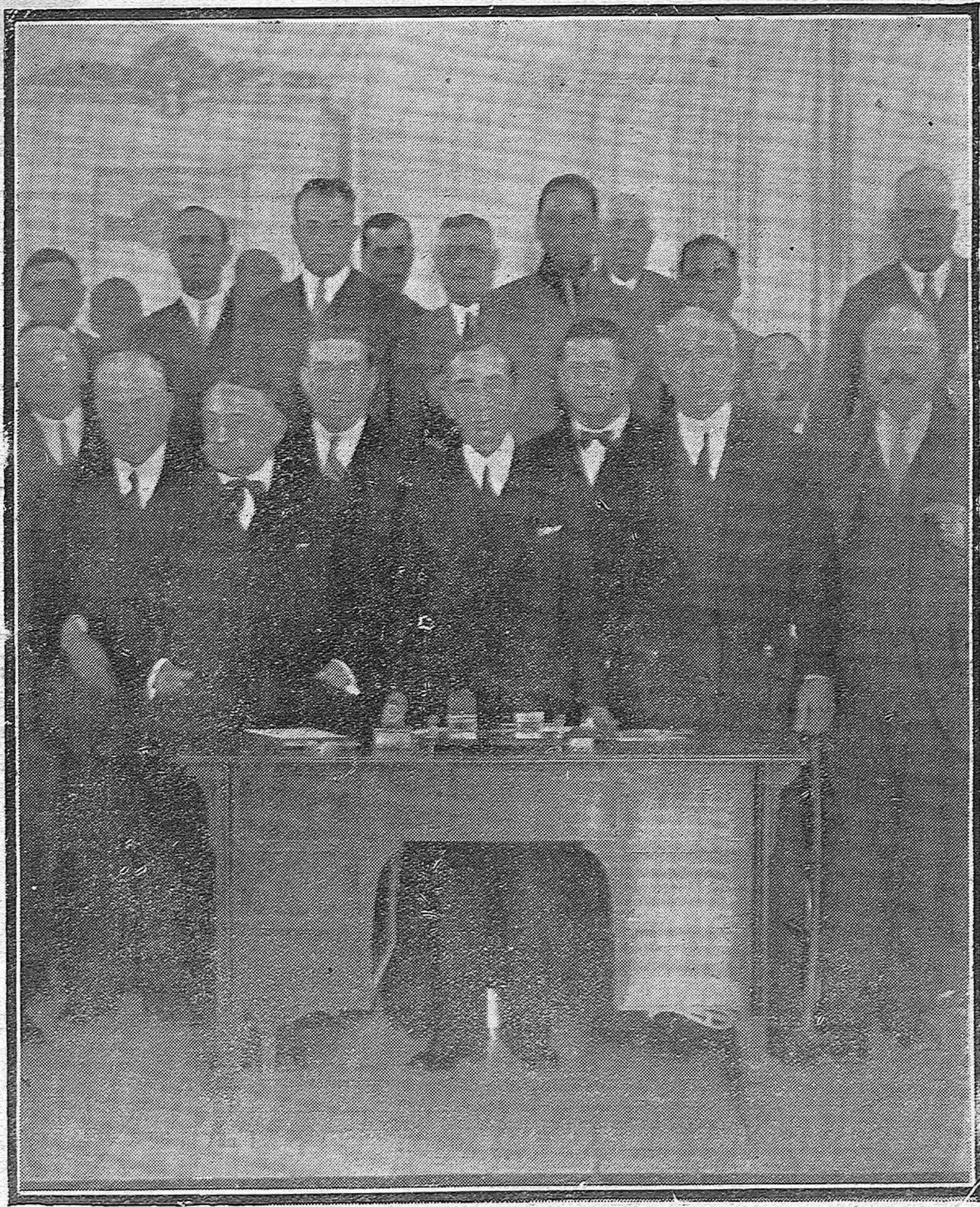
CORDOBA.—Presidencia de la importante asamblea celebrada esta mañana por los agricultores de toda la provincia.