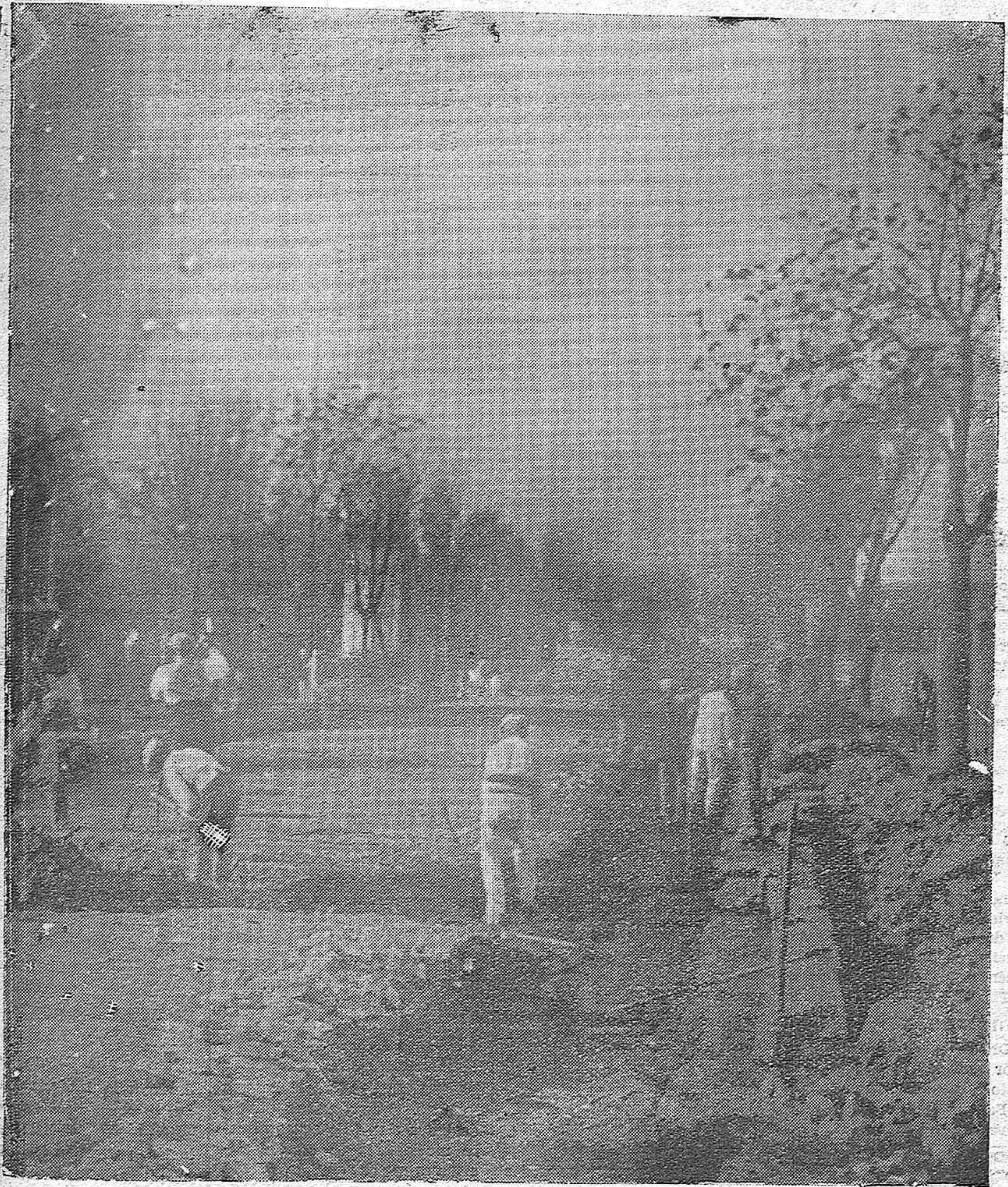
MEJORAS DE LA CIUDAD.—Comienzo de las obras de pavimentación de las Rondas por cuenta del Estado