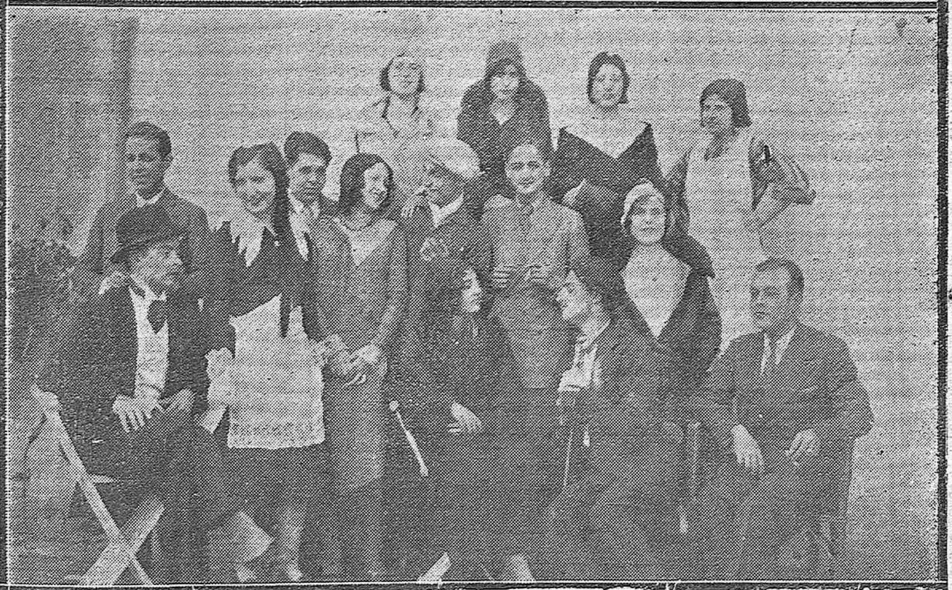
FUNCION BENEFICA EN PORCUNA. —Distinguidos jóvenes de la buena sociedad de este pueblo que interpretaron el coro de "Los románticos", en función a beneficio de los p obres.—Grupo de bellas muchachas y distinguidos jóvenes que pusieron en escena "Piola", en la citada función benéfica.