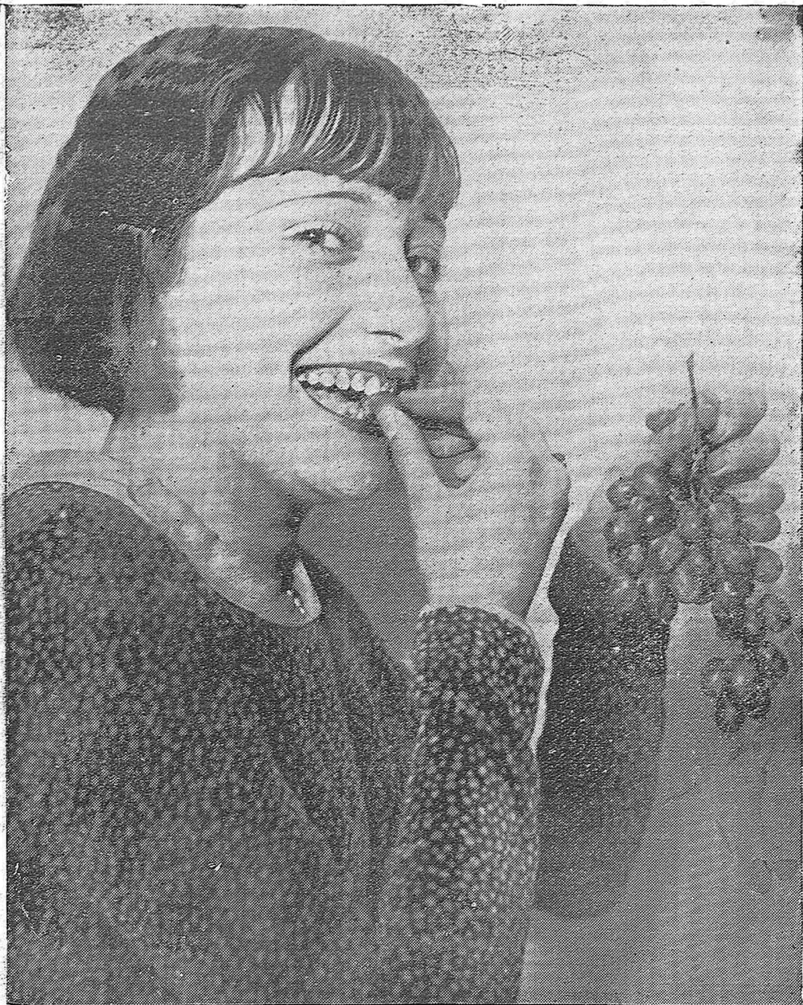
LA UVAS DE LA FELICIDAD.—He aquí una linda muchacha cordobesa comiéndose las doce uvas de Año Nuevo. Su rostro optimista y su ancha sonrisa son ya una promesa de felicidad.