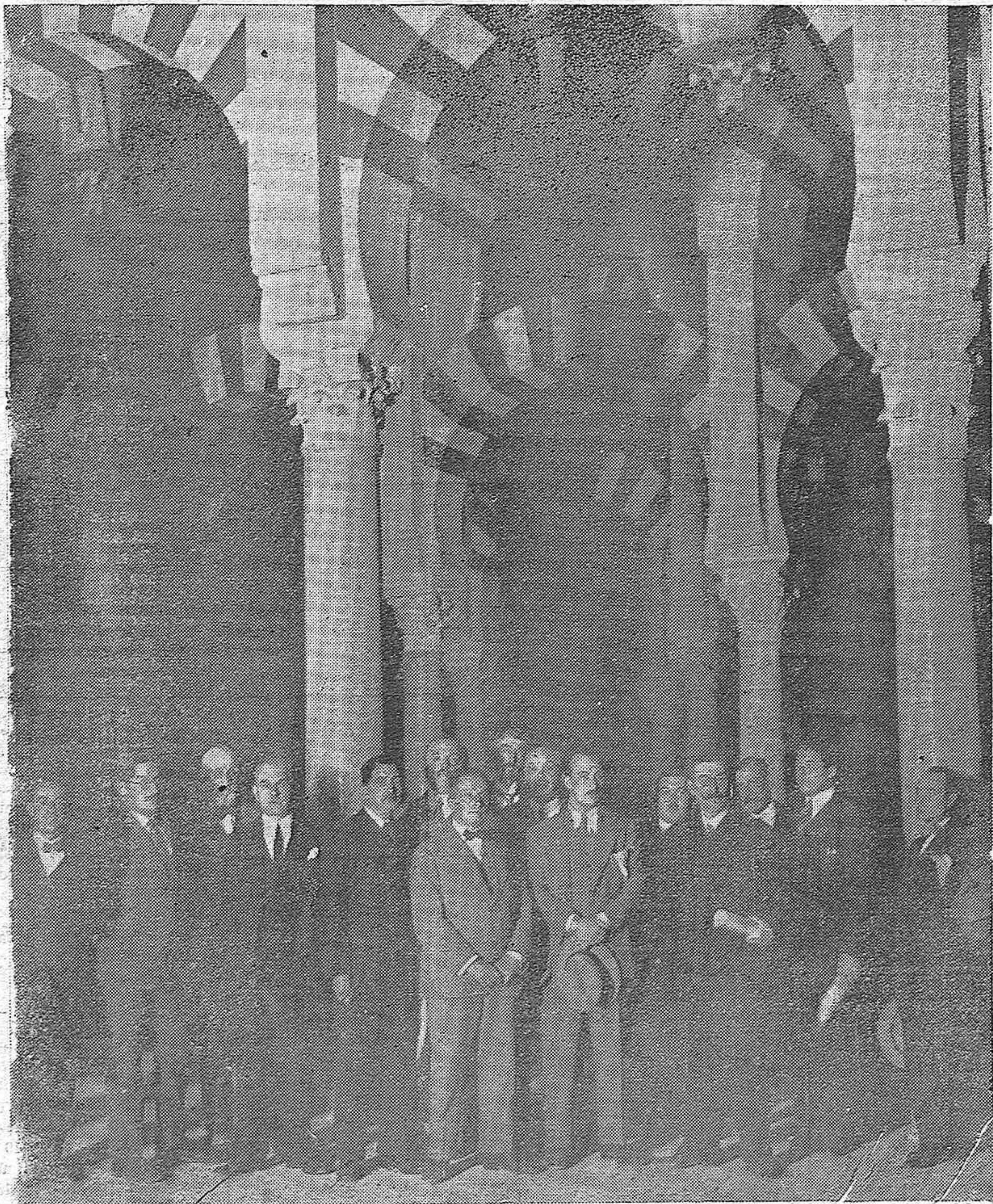
LOS PERIODISTAS FRANCESES EN NUESTRA CAPITAL.—LOS EXCURSIONISTAS DURANTE LA VISITA QUE HICIERON A LA MEZQUITA CATEDRAL