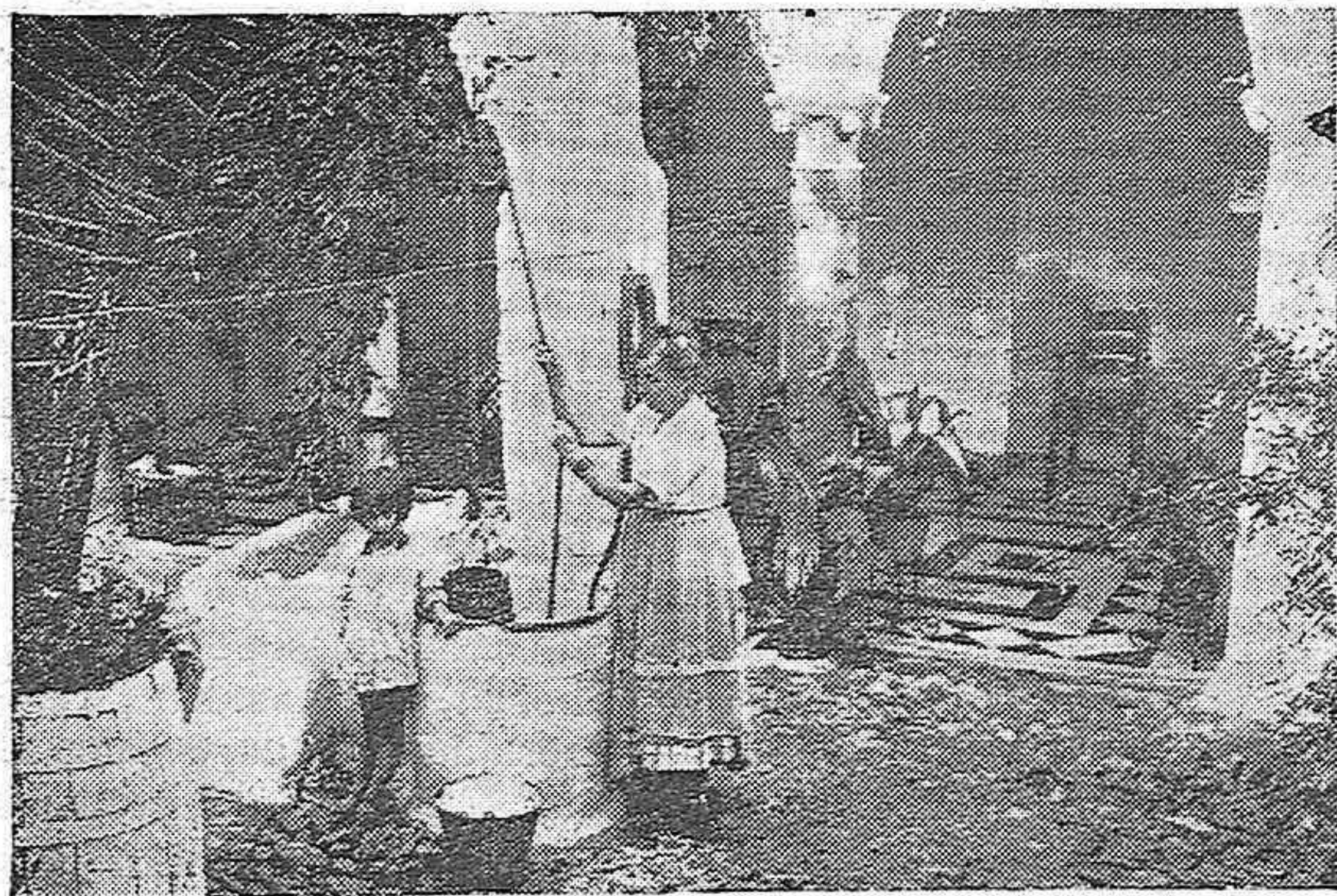
...CHIRRIÁ LA GARRUCHA EN EL POZO SACANDO LA ÚLTIMA GOTA...

Irrumpe la muchachada en el barrio y hasta los geraneos se alegran al recibir a las chiquillas.