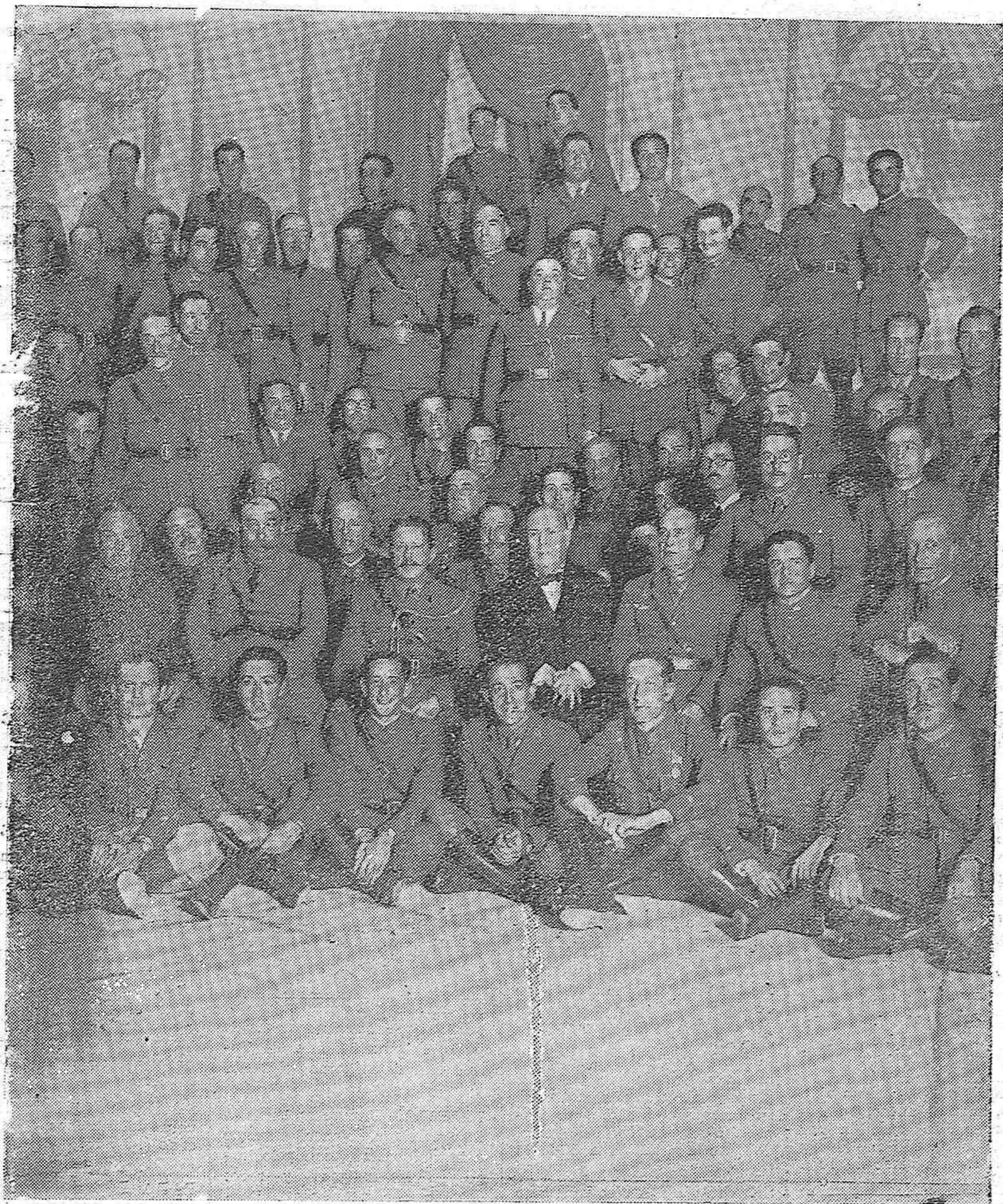
JEFES DE LAS MANIOBRAS.—EL CAPITAN GENERAL DE LA REGION CON LOS JEFES Y OFICIALES QUE ASISTIERON AL VINO DE HONOR CON QUE FUERON OBSEQUIADOS POR LA GUARNICION