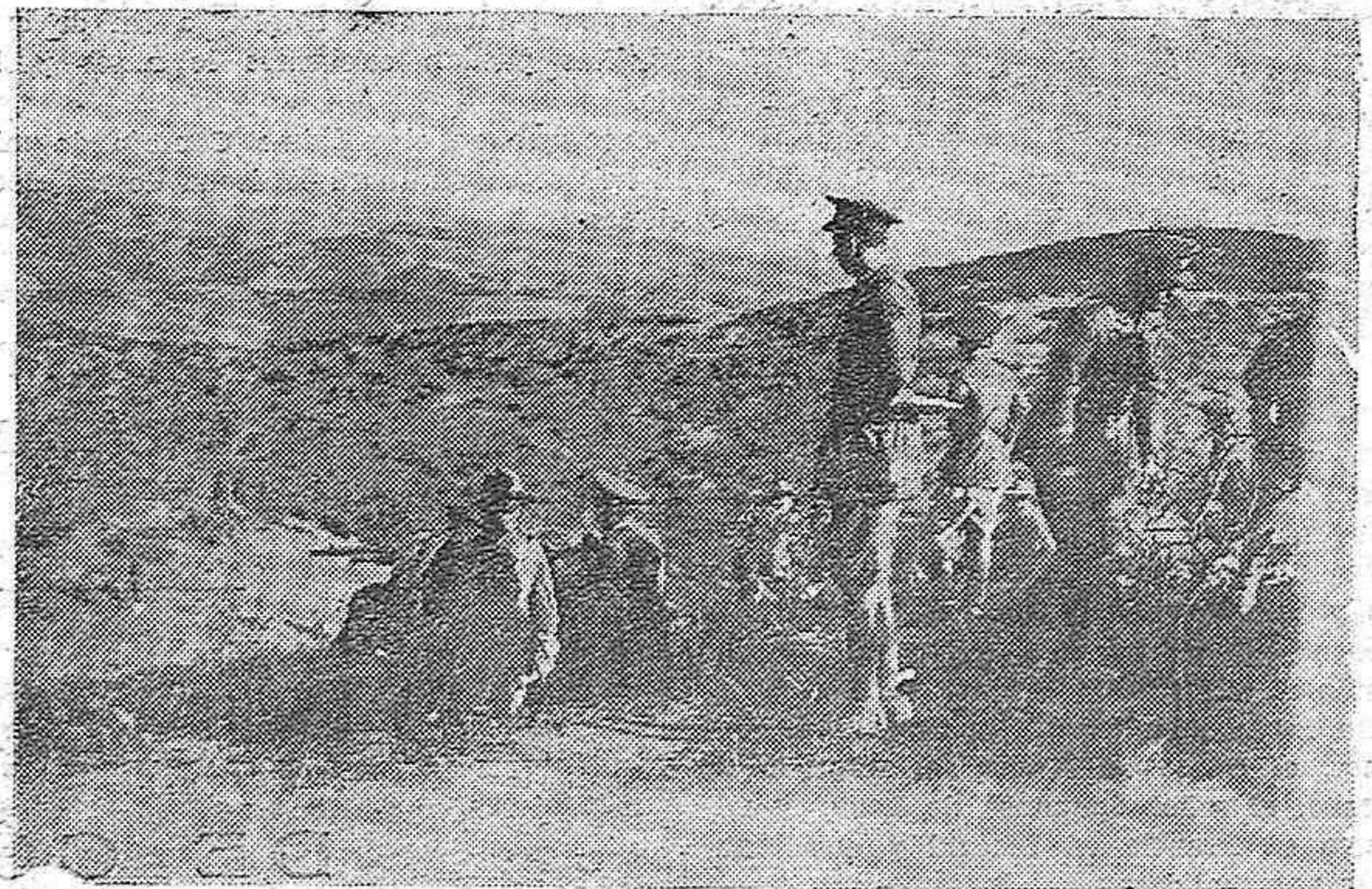
CERRO MURIANO.—LAS MANIOBRAS MILITARES.—UNA SECCION DE AMETRALADORAS ENCARGADA DE DEFENDER UNA POSICION

Mañana a las diez de la noche y en el domicilio social de "El Figaro Cordobés" se celebrará una verbena, organizada por dicha sociedad en honor de sus socios.