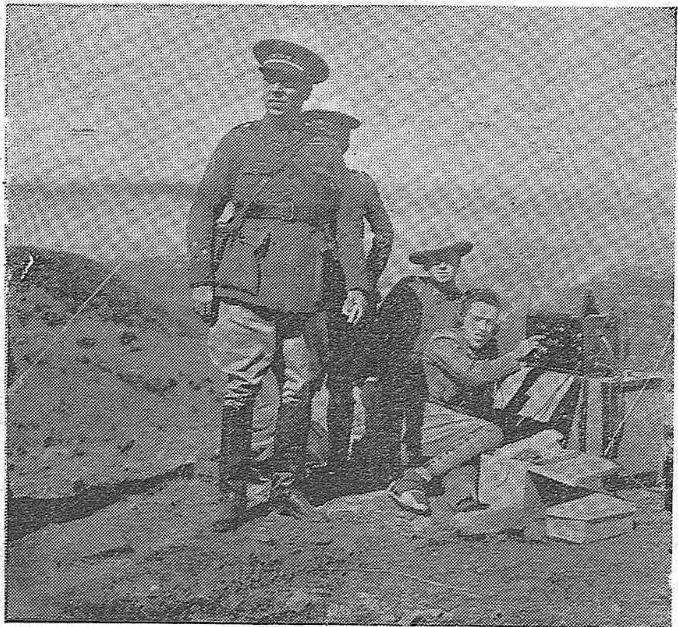
CERRO MURIANO.—LAS MANIOBRAS MILITARES.—LOS PUESTOS DE RADIODIFUSIÓN COMUNICANDO CON LOS AEROPLANOS