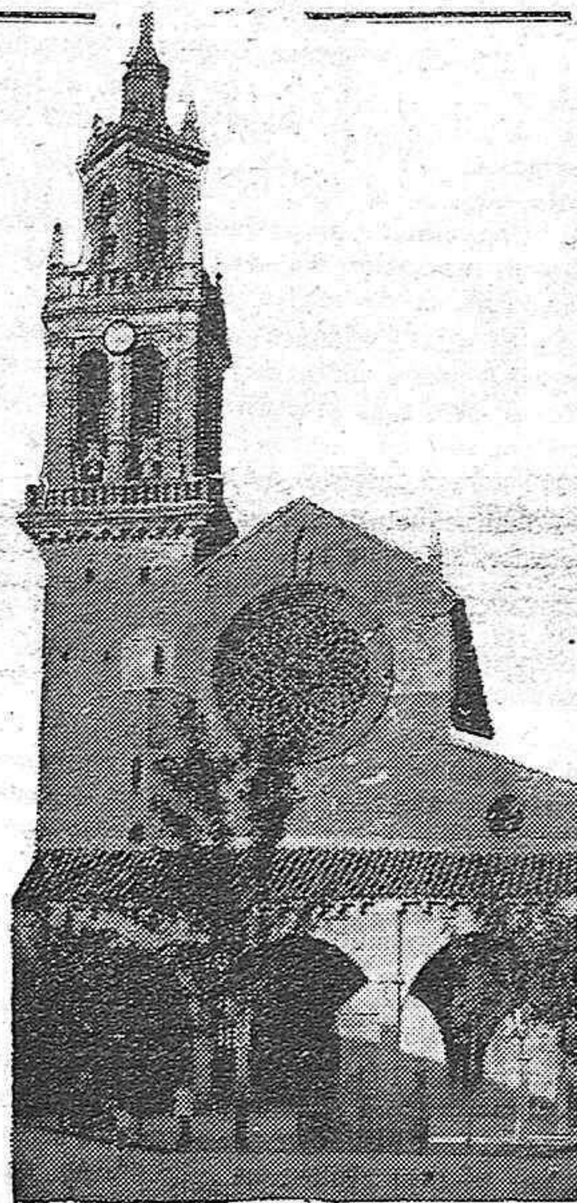
...EN EL FRÓNTIS SE DIBUJA UN ROSETÓN DE PIEDRA CALADA...

Vienen del taller o de la fábrica. Brillan sus ojos con anhelos de libertad y descanso, asediadas por los mozuelos. Sus faldillas de percal revuelan por su talle postinoso, y traen el canasto o la bolsa con infulas de trofeo.