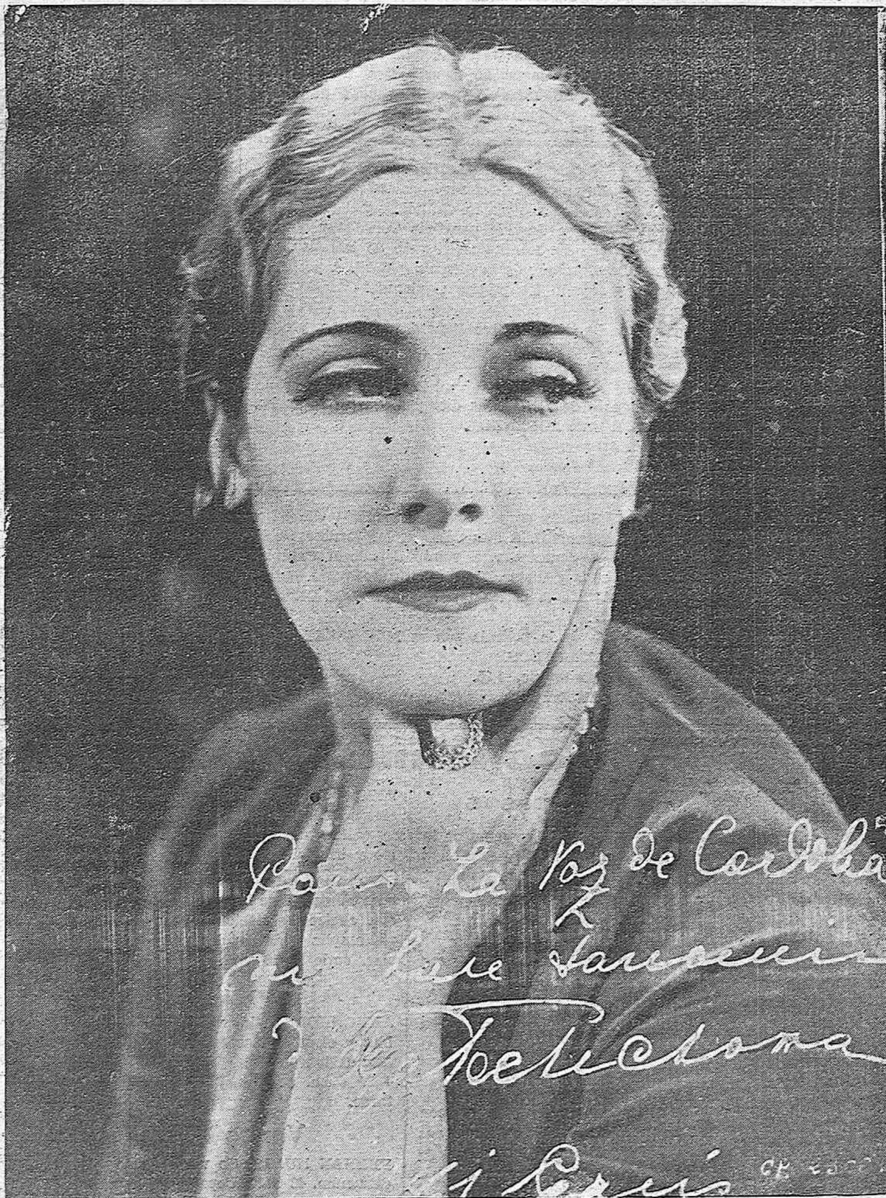
ARTISTAS DE LA PANTALLA.—La célebre trágica rusa Olga Yschechowa, protagonista de varias importantes películas que ha tenido la gentileza de dedicarnos esta fotografía.