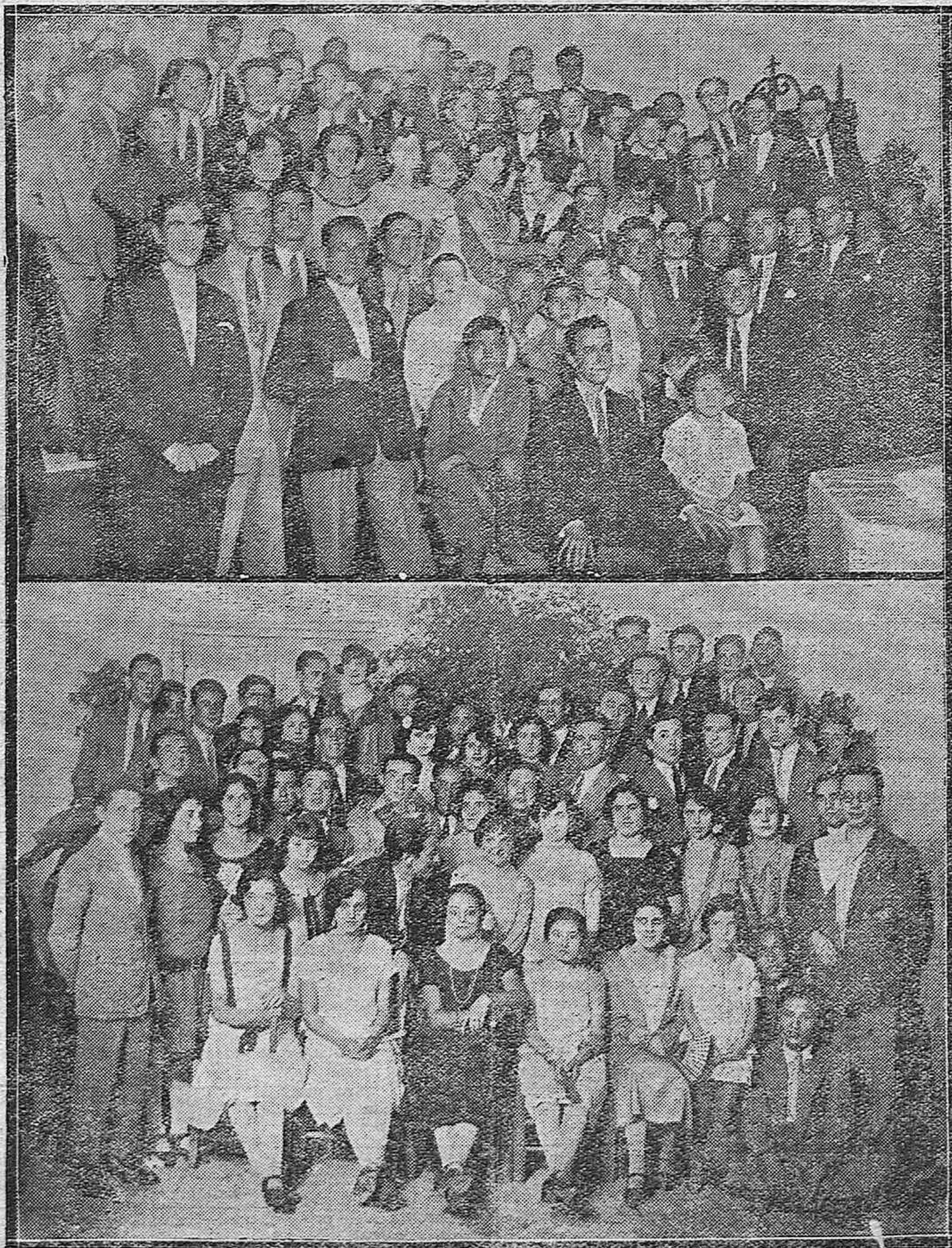
Grupos de concurrntees a las típicas verbenas recientemente celebradas por el Real Centro.Fi-larmónico E. Lucena, y la Sociedad Mercantil Recreaiva.