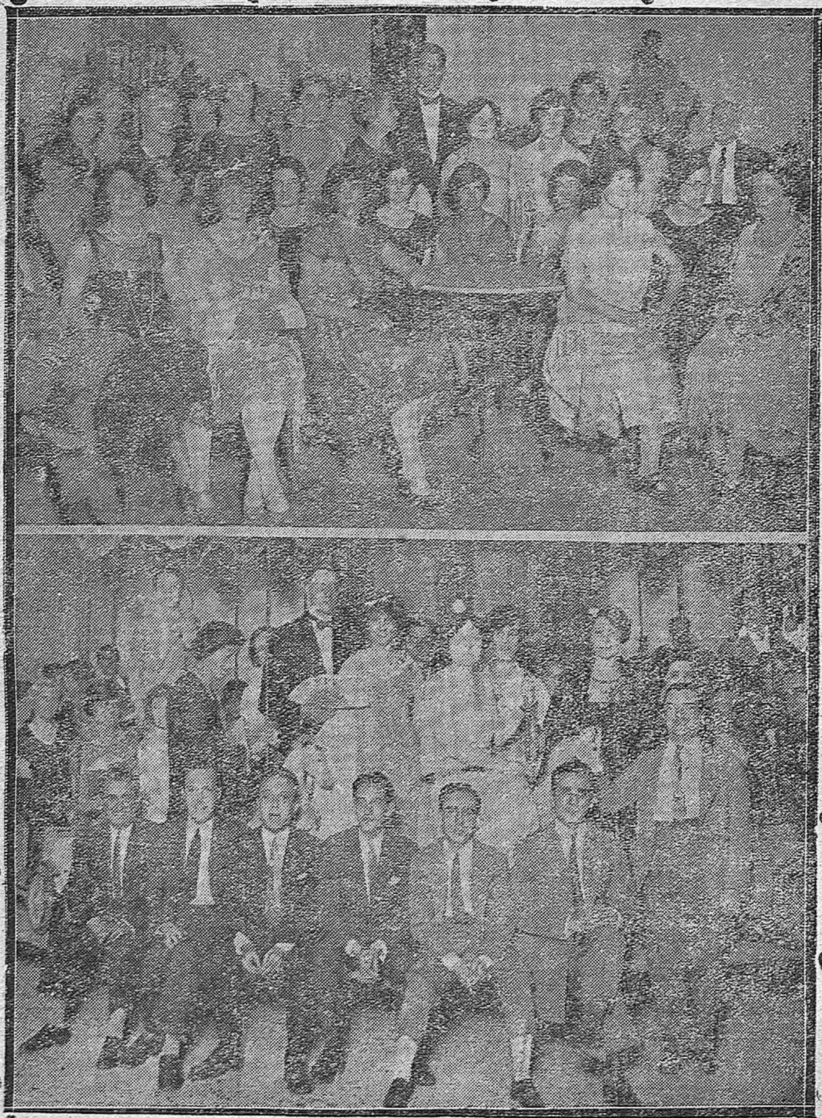
Los estudiantes del Instituto de las Españas de Nueva York en la verbena del Círculo de la Amistad, organizada en su obsequio.