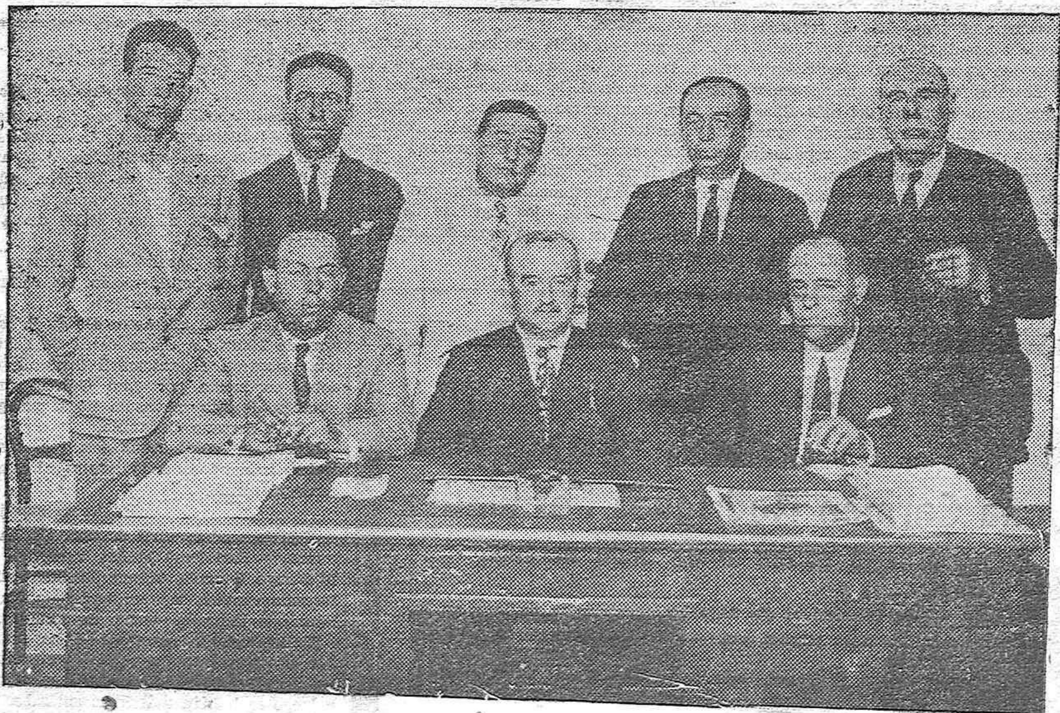
Y NUEVA DIRECTIVA.—Los miembros que constituyen la nueva directiva de la Asociación de Colonos arrendatarios de fincas rústicas

OCASION: Vestiditas para niños a 0'75 pesetas. Peleles a 1'10 y calcetines niños, desde 0'20 en EL METRO y sus Sucursales.