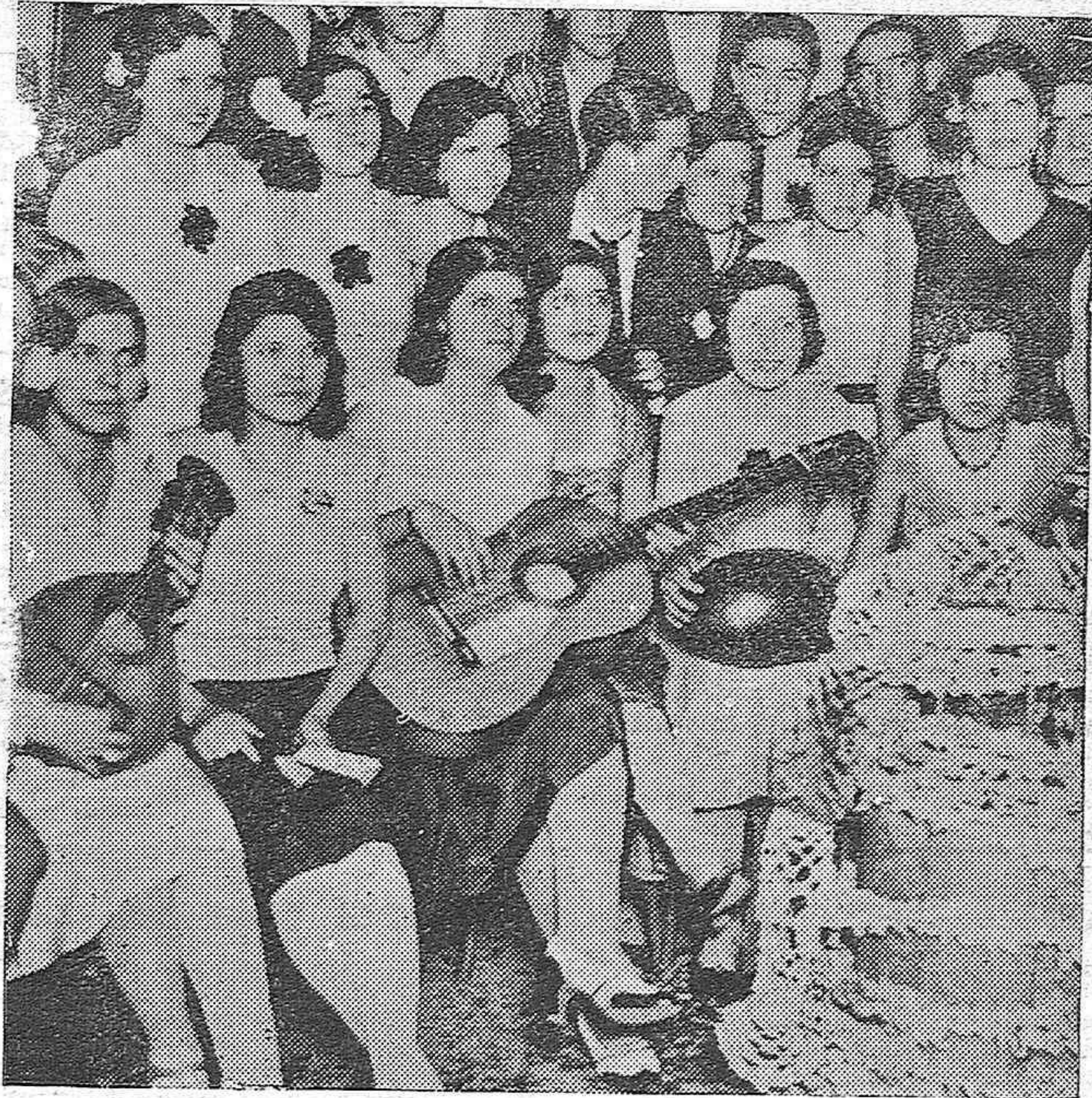
He aquí un grupo de asistentes a una fiesta popular. Las "nenas" marean de guapas y prestan a estos simpáticos festejos su principal atractivo