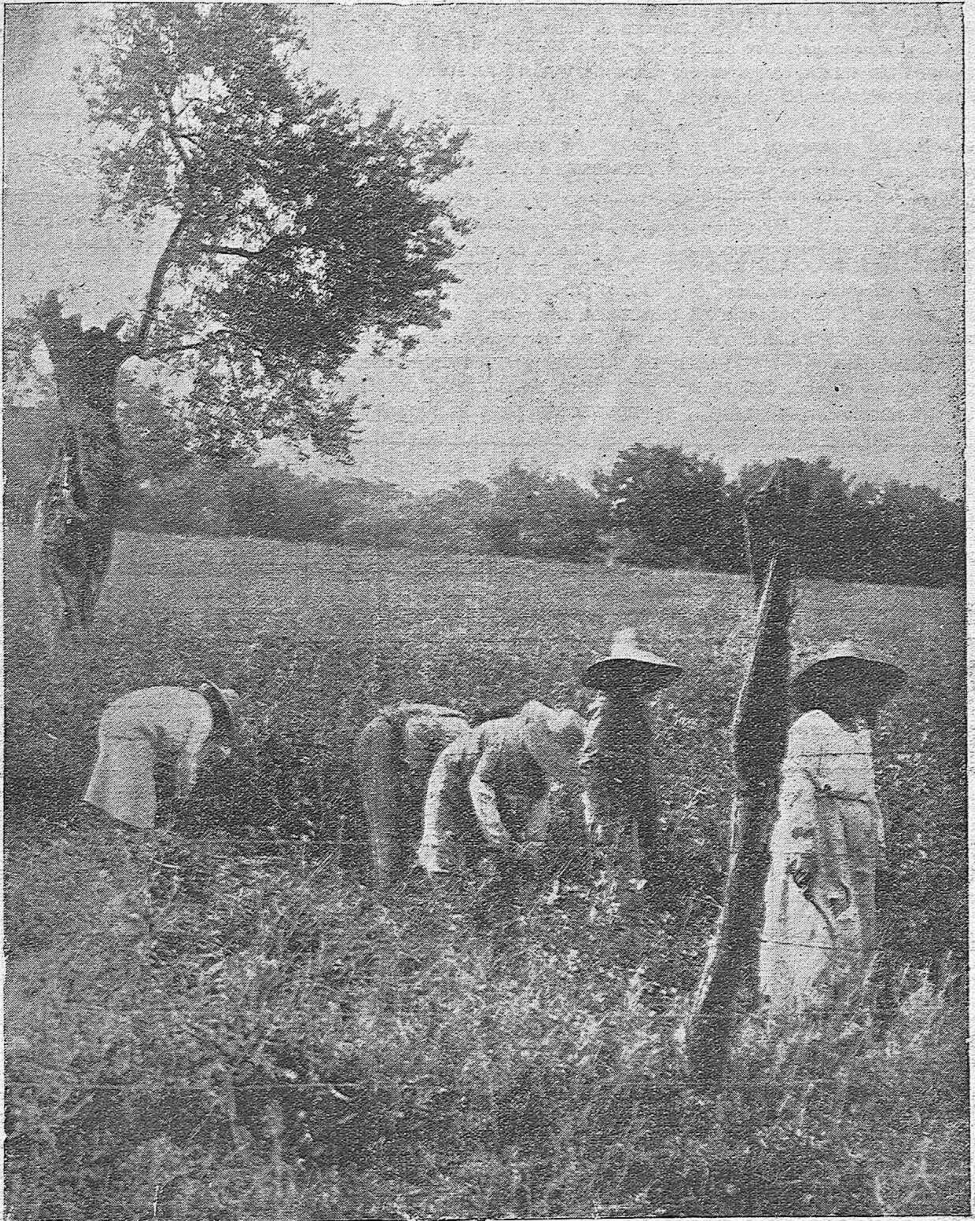
EL PROBLEMA DEL CAMPO.—Grupo de mujeres entregadas a la faena de la siega, por encontrarse en huelga los obreros campesinos