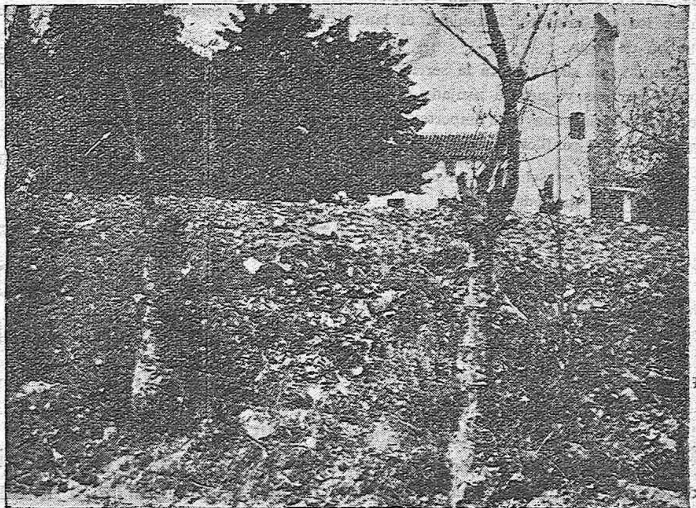
Enorme montón de basuras, acumulado en la Huerta del Vado, que constituye un peligroso foco de infección para los hortelanos de la Fuensanta.