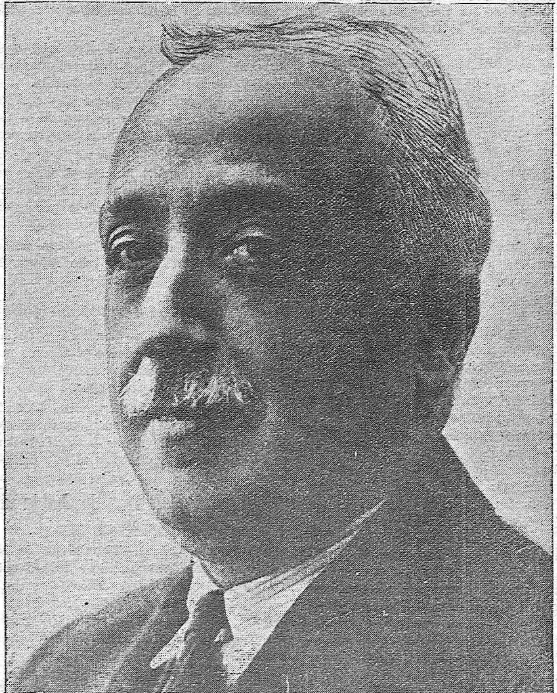
D. NICETO ALCALA ZAMORA, ilustre paisano, ex presidente de la República que, descansando de las tareas de gobernante, pasa unos días en su finca La Ginesa, del término municipal de Priego