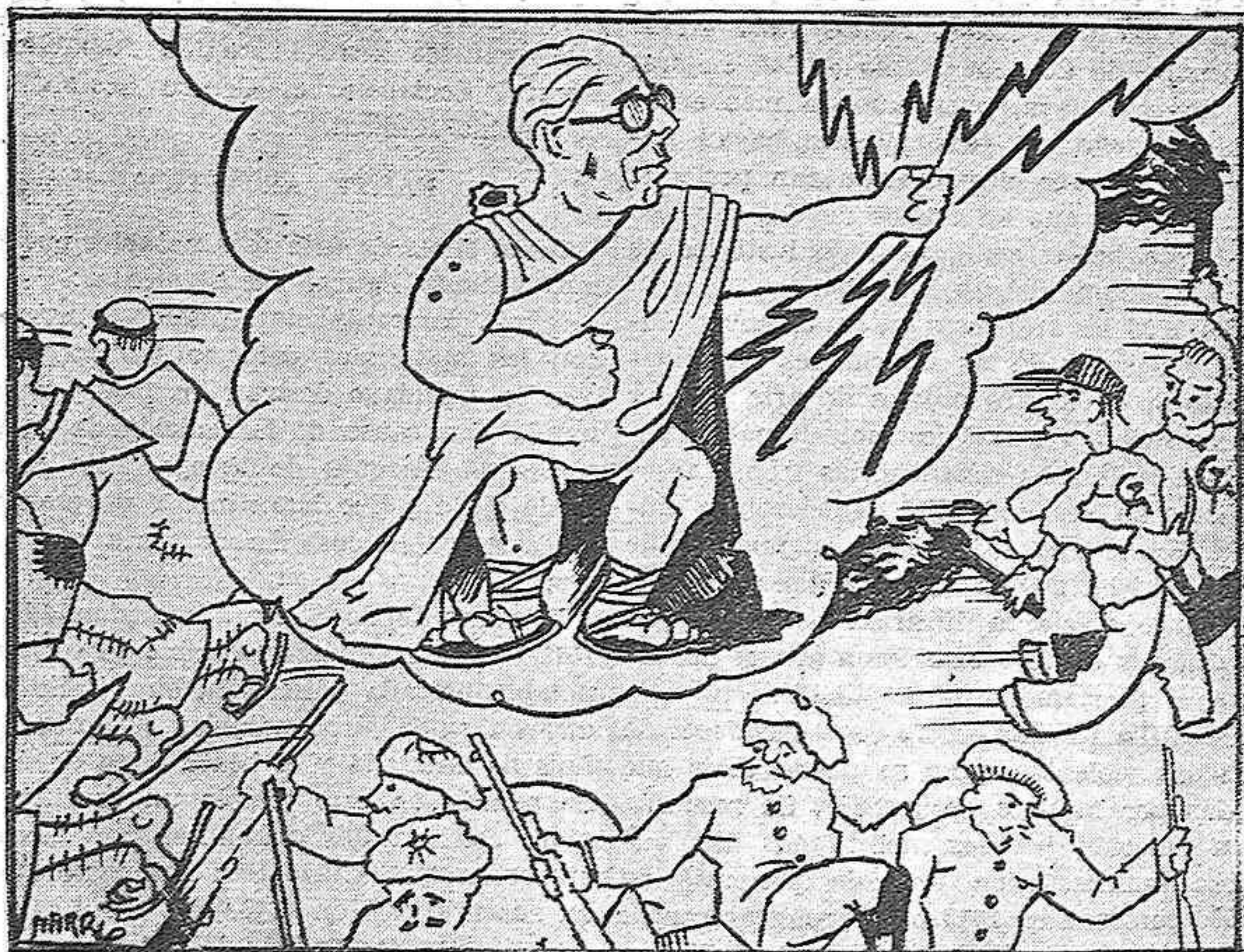
Júpiter AZAÑA.—¡Ay del que se levante contra la República!