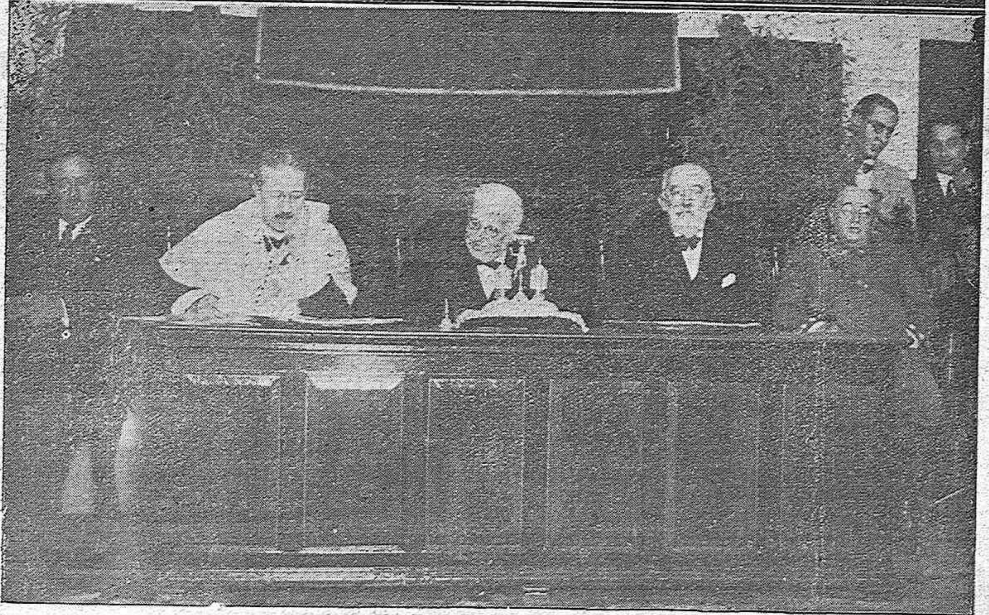
LA APERTURA DEL CURSO ACADÉMICO 1931-32.—Alumnos de ambos sexos del Instituto de Segunda Enseñanza de Córdoba, que han obtenido premio en el curso anterior.—Las autoridades que presidieron el solemne acto, en el que ostentó la representación del Ministro de Justicia el presidente del Tribunal Supremo don Diego Medina.