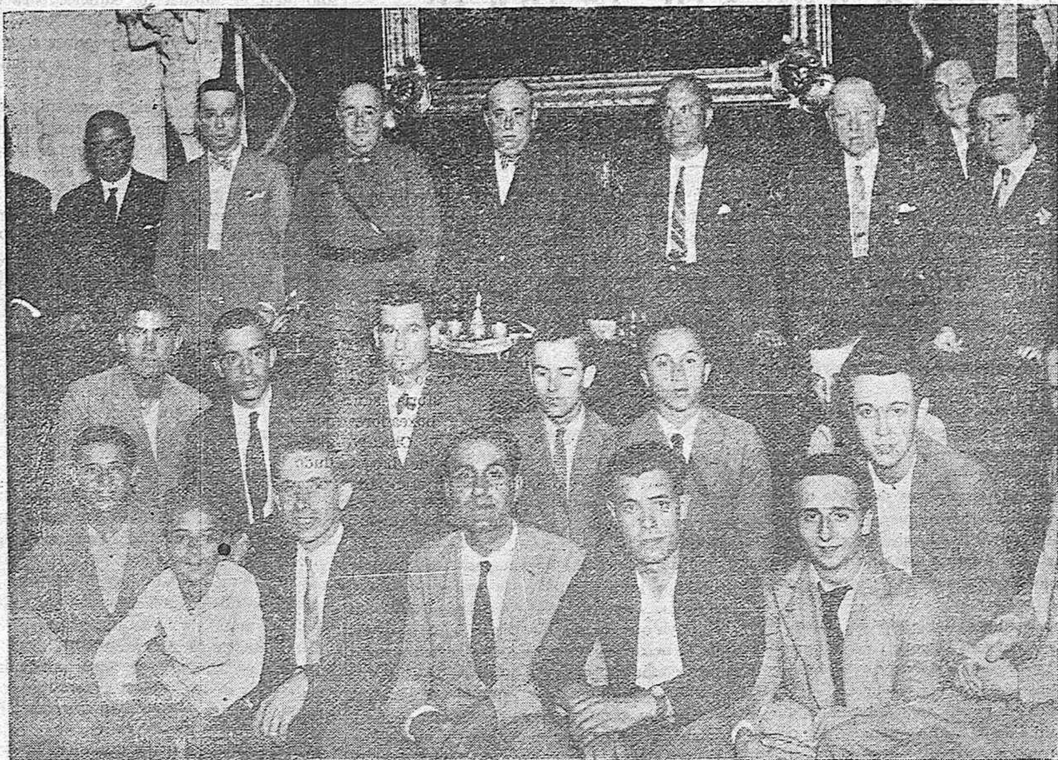
EL PATRONATO DE FORMACION PROFESIONAL.—Las autoridades y alumnos de la Escuela de Trabajo que han sido agraciados en el reparto de becas