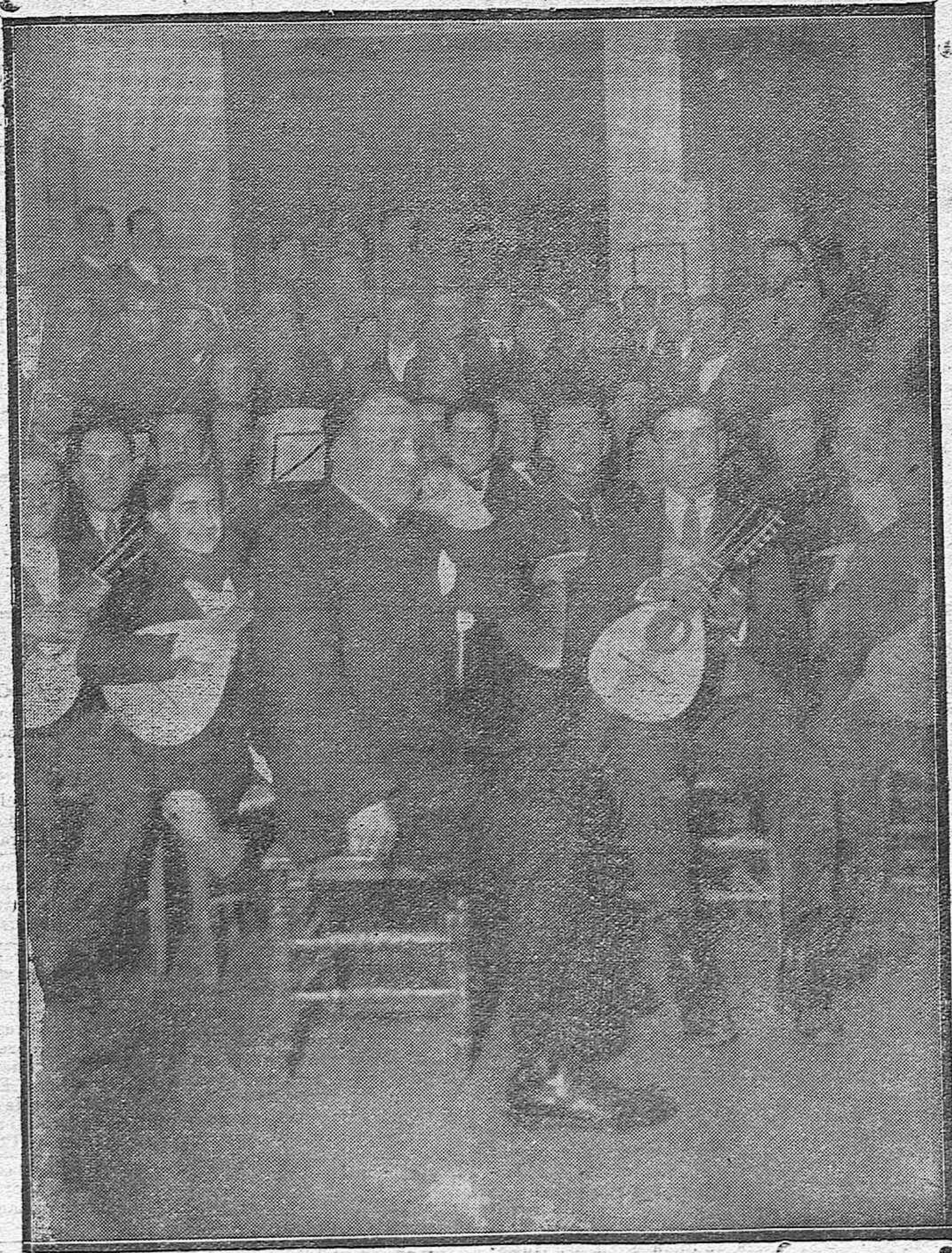
EN EL REAL CENTRO FILARMÓNICO DE EDUARDO LUCENA.—Uno de los últimos ensayos que se están celebrando con motivo de la próxima excursión artística a Cádiz en los días de Carnaval.