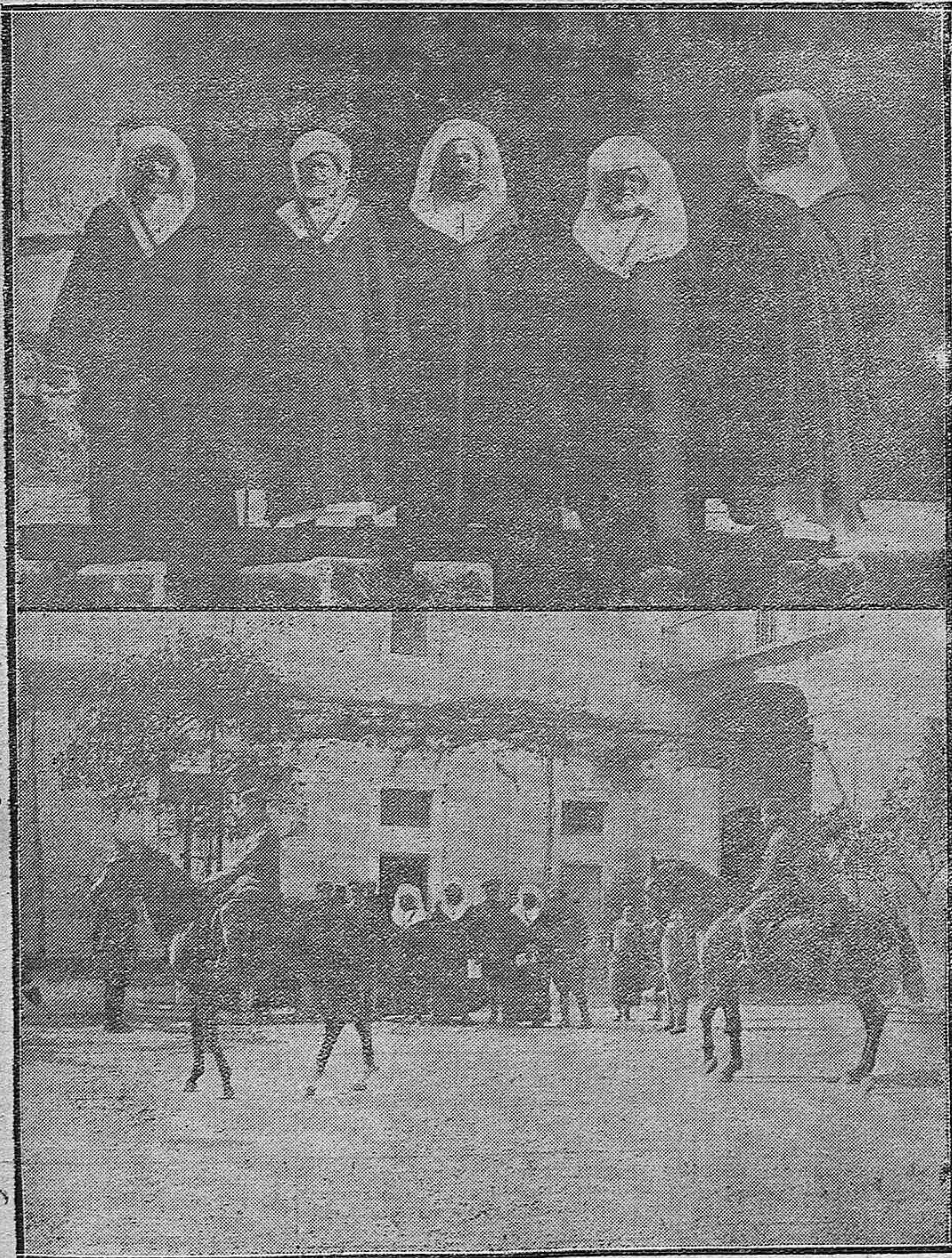
El prestigioso moro Abd-el-Kader y moros notables que le acompañan en su visita a Córdoba.--Los cafés marroquies durante su visita al Depósito de caballos Sementales examinando algunos ejemplares.