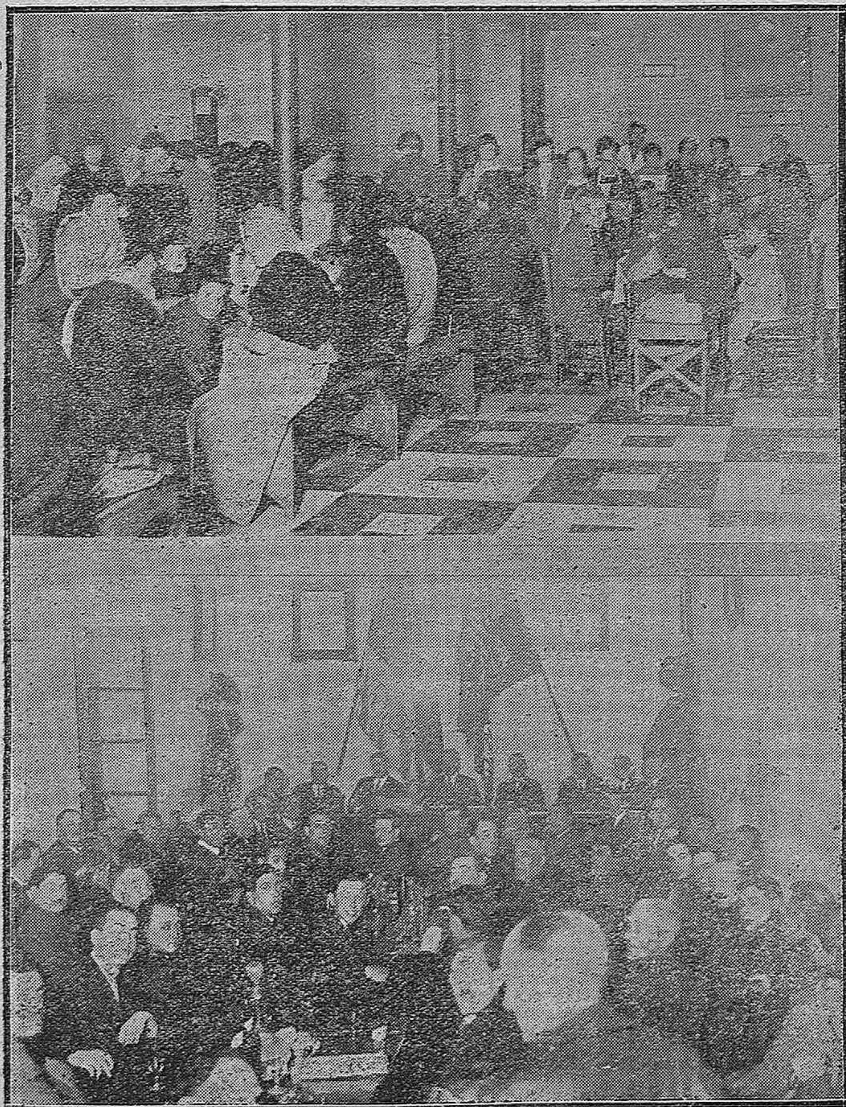
Aspecto que ofrecía el Comedor de Caridad, durante la comida con que nuestro Prelado obsequió a los pobres.--El salón de actos del Casino Republicano en la fiesta celebrada para conmemorar el aniversario de la proclamación de la República en España.