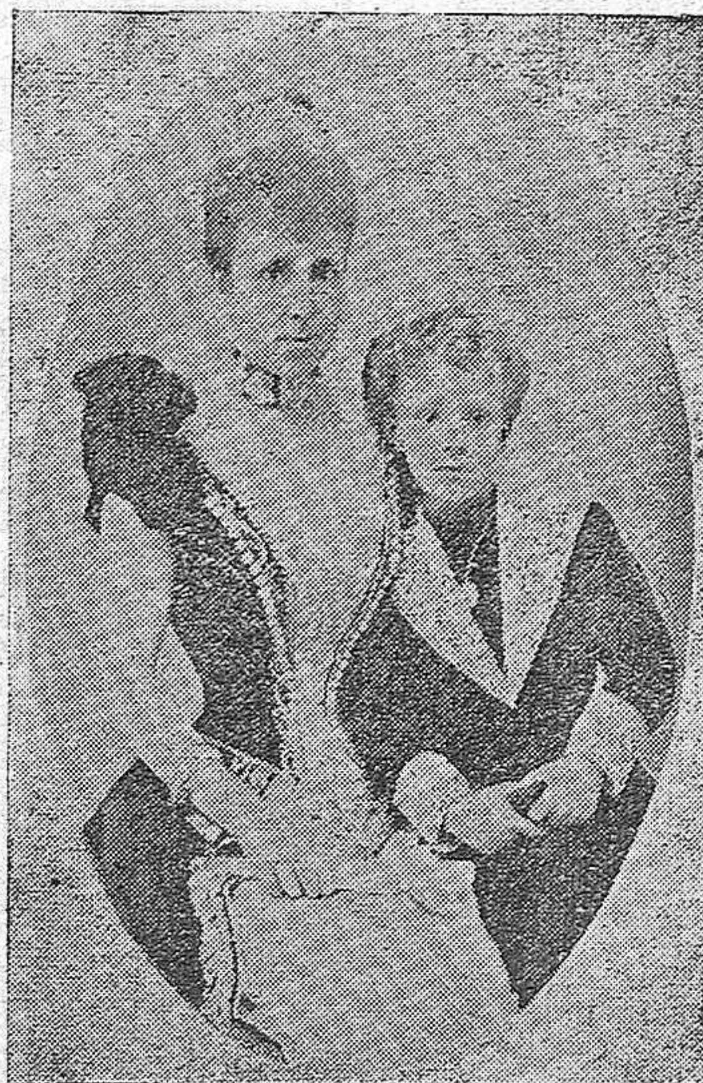
S. M. LA REINA DOÑA MARIA CRISTINA, CON EL REY DON ALFONSO XIII AL CUMPLIR ÉSTE LOS CINCO AÑOS.