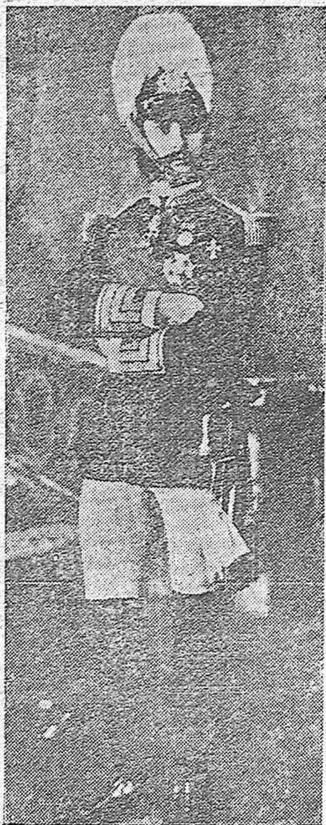
S. M. EL REY DON ALFONSO XII ESPOSO DE DOÑA MARÍA CRISTINA, POCO ANTES DE SU FALLECIMIENTO. OCURRIDO EN NOVIEMBRE DE 1885.

Ella parece ser que accedió, no por conservar su vida, sino por razones de Estado. Pero cuando sintió llegar a su marido, olvidándolo todo, corrió a su encuentro con los brazos abiertos y le besó llorando de alegría.