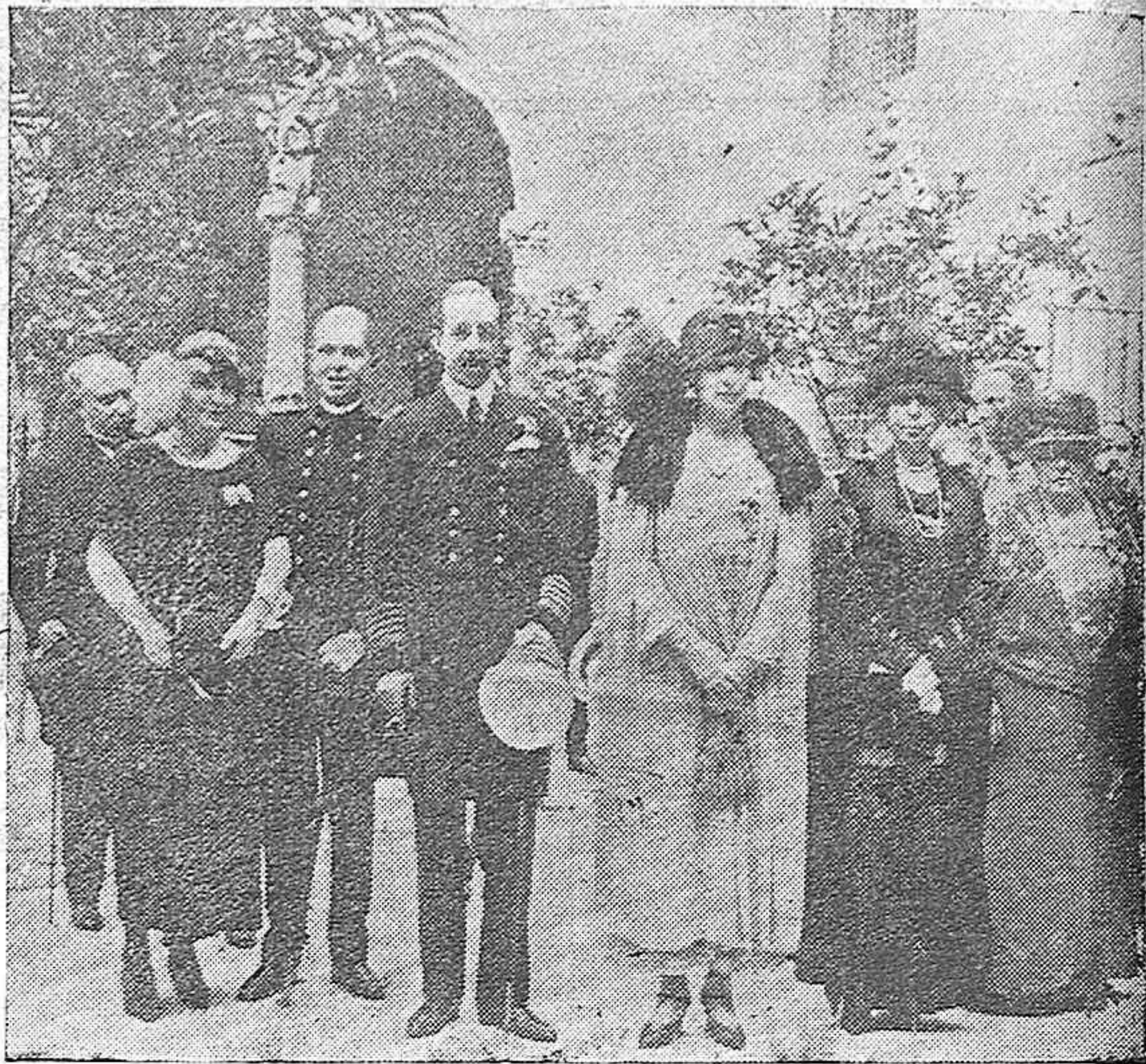
INTERESANTE Y RECIENTE GRUPO DE LOS SOBERANOS ESPAÑOLES. PRINCIPE HEREDERO, DOÑA MARÍA CRISTINA E INFANTA ISABEL.

Con motivo de la guerra de Cuba, hizo falta dinero en oro para el sostenimiento de nuestra escuadra en las colonias, pues los billetes no tenían circulación, por estar depreciados. El Gobierno contaba con muy escasa cantidad. La escuadra veíase a punto de no poder salir. Enterada la Reina, ha-