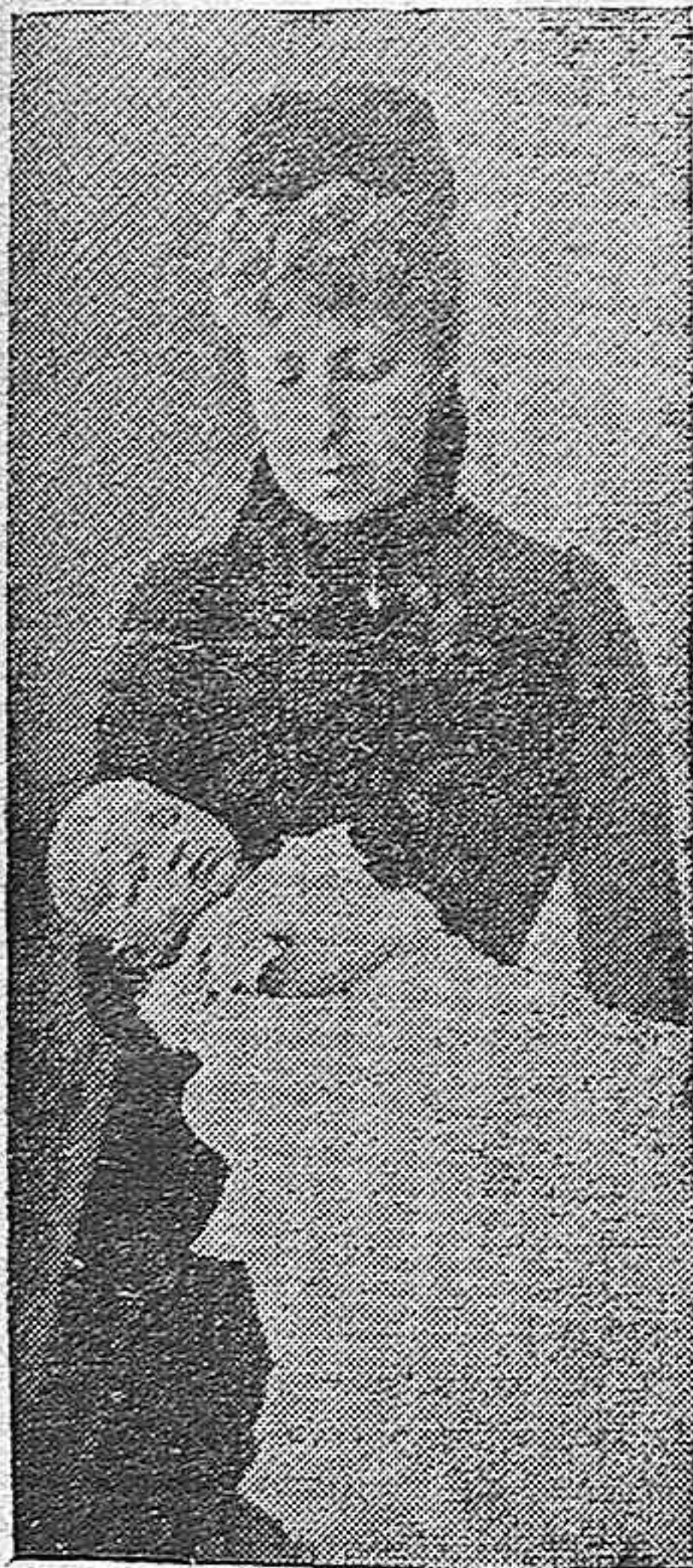
S. M. LA REINA DOÑA MARIA CRISTINA, TENIENDO EN BRAZOS A SU HIJO DON ALFONSO CUANDO ÉSTE CONTABA CUATRO MESES.