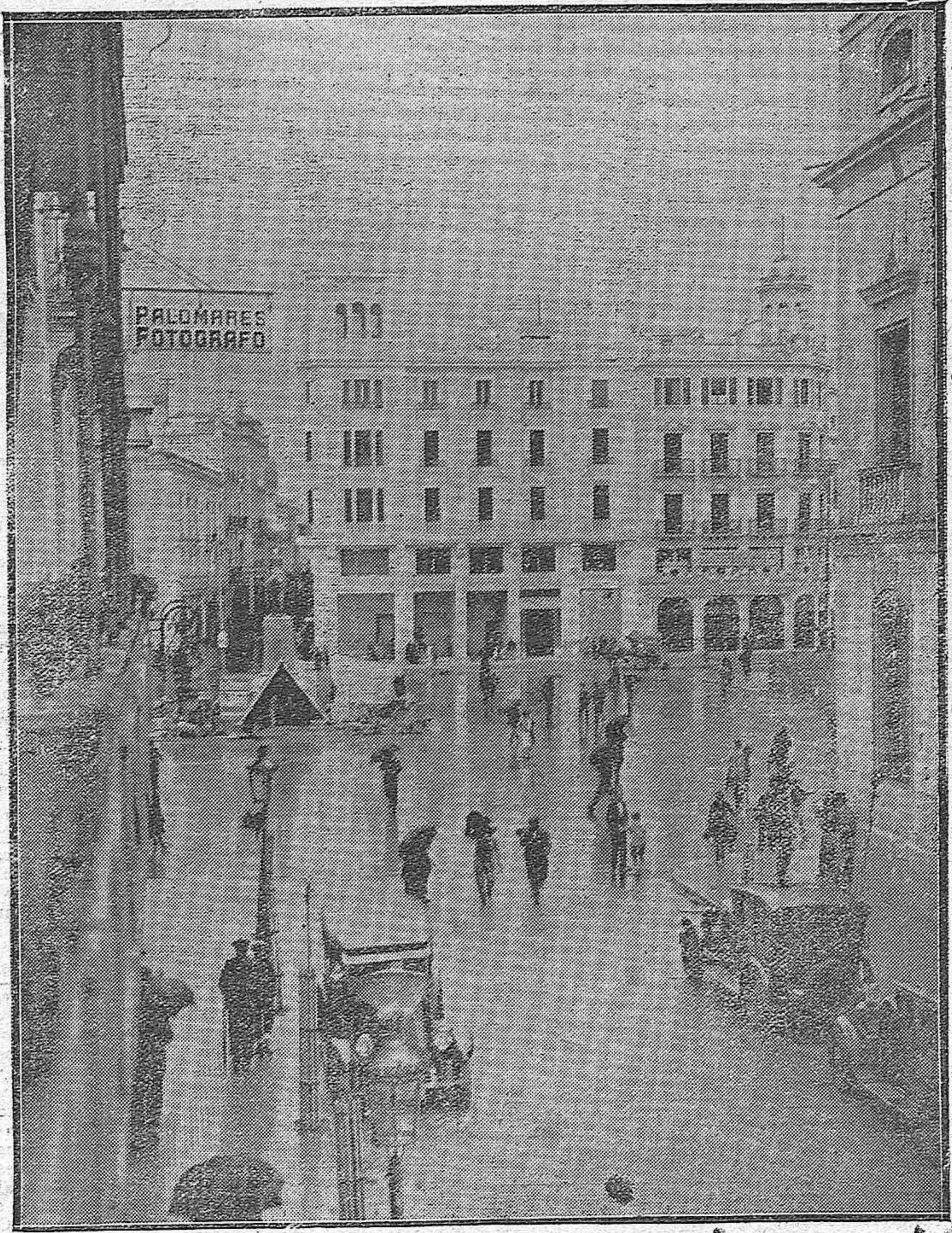
PLAZA DE LAS TENDILLAS.—ENTRE LA CALLE GOMDOMAR Y CLAUDIO MARCELO—ELEGANTE Y COQUETA, AQUÉLLA; MODERNA Y FEBRIL ÉSTA, CON EL BULLICIO DE SUS ESTABLECIMIENTOS Y SUS GRANDES «MAGASINS»—SE EXTIENDE ESTA BELLÍSIMA PLAZA DE MODERNO TRAZADO Y MAGNÍFICA PAVIMENTACIÓN, QUE REVELA UN ACERTADO SENTIDO DEL ENSANCHE Y-DE LA URBANIZACIÓN CORDOBESA.