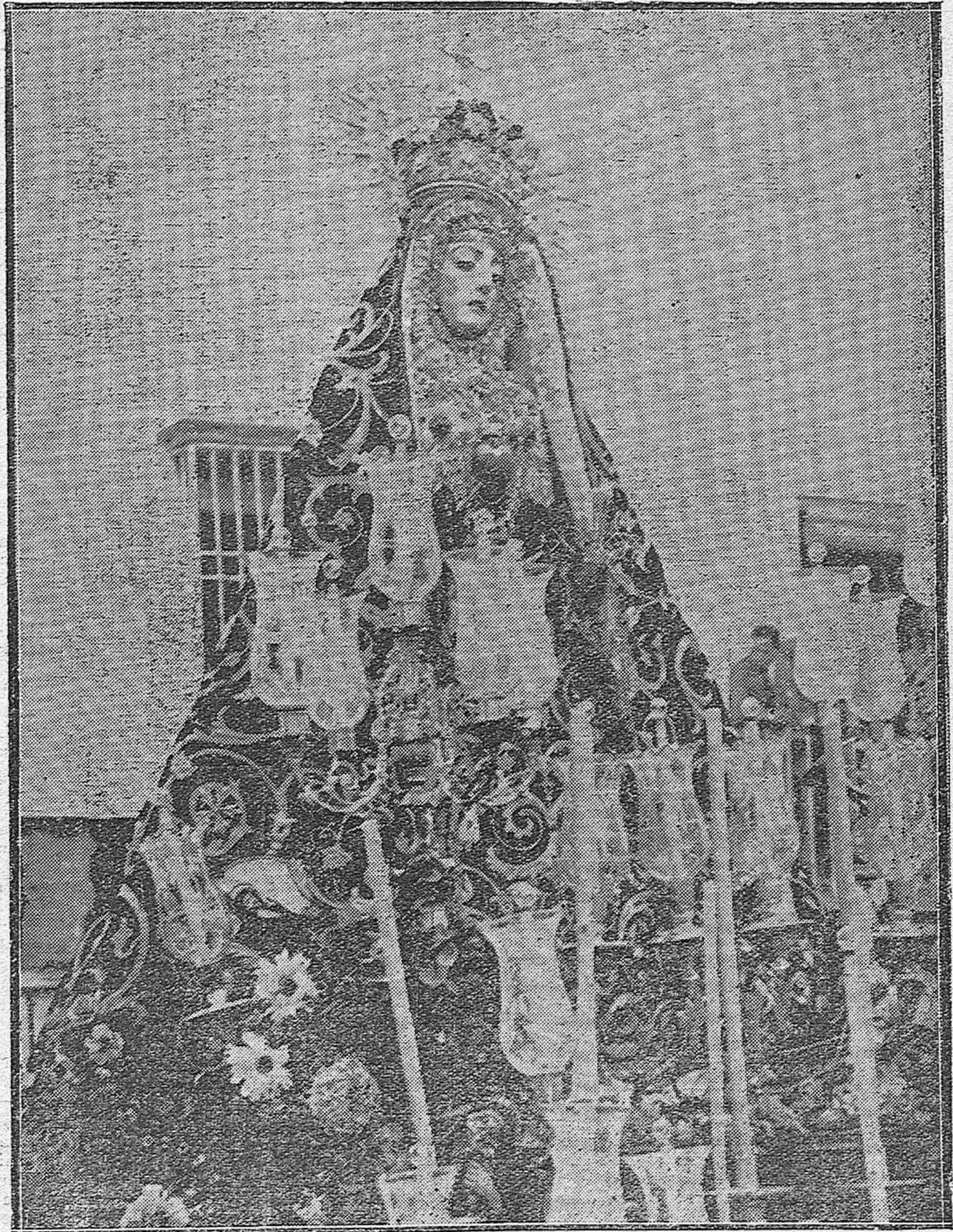
LA SEMANA SANTA EN CÓRDOBA.—Bellísimo paso de la Virgen de los Dolores, una de las más firmes y románticas devociones del pueblo cordobés.