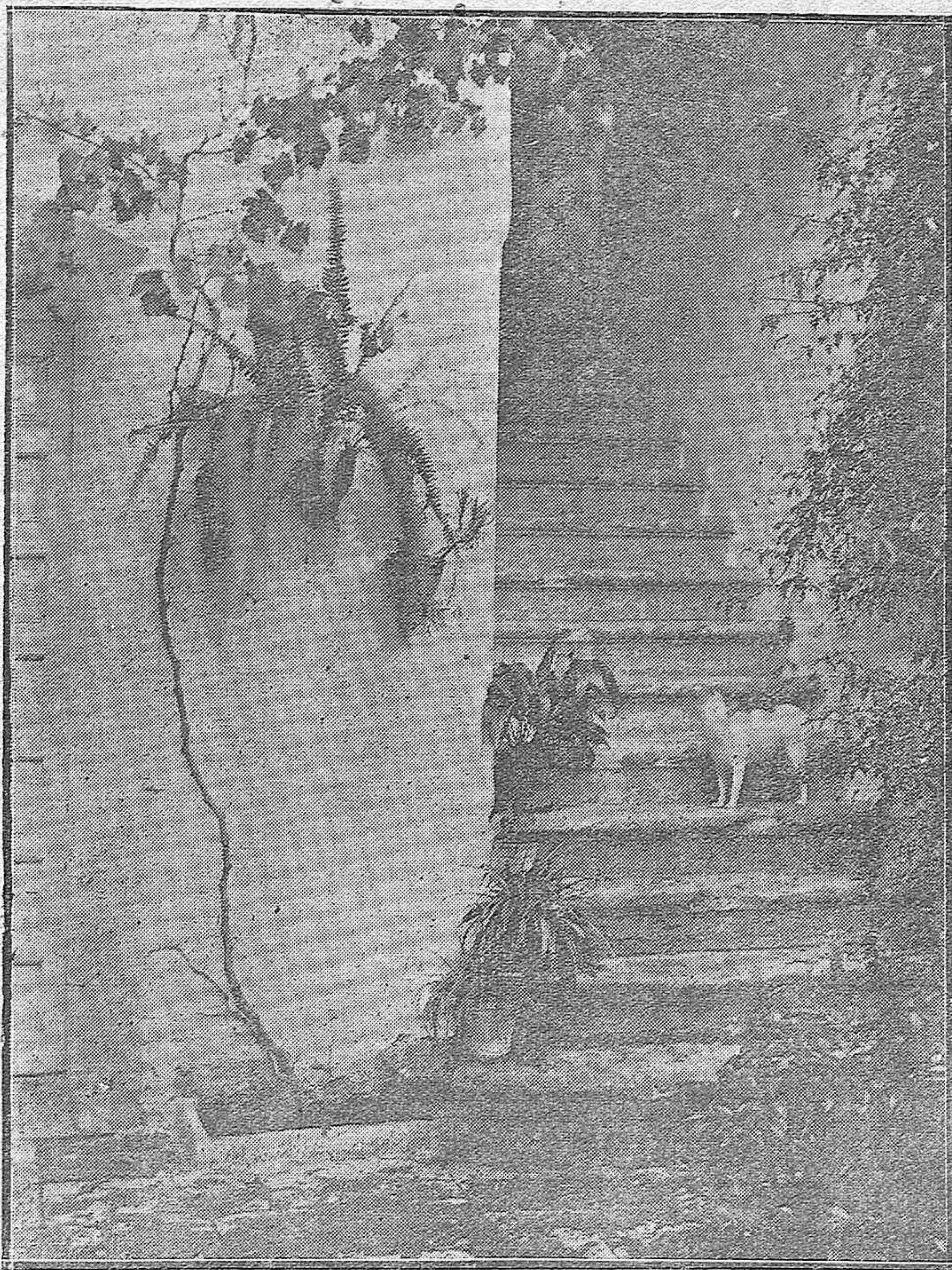
DEL PROYECTADO MUSEO DE LA MEZQUITA CATEDRAL.—Vista de la escalera principal de la casa de la calle Comedias que da acceso a los salones que servirán de Museo.