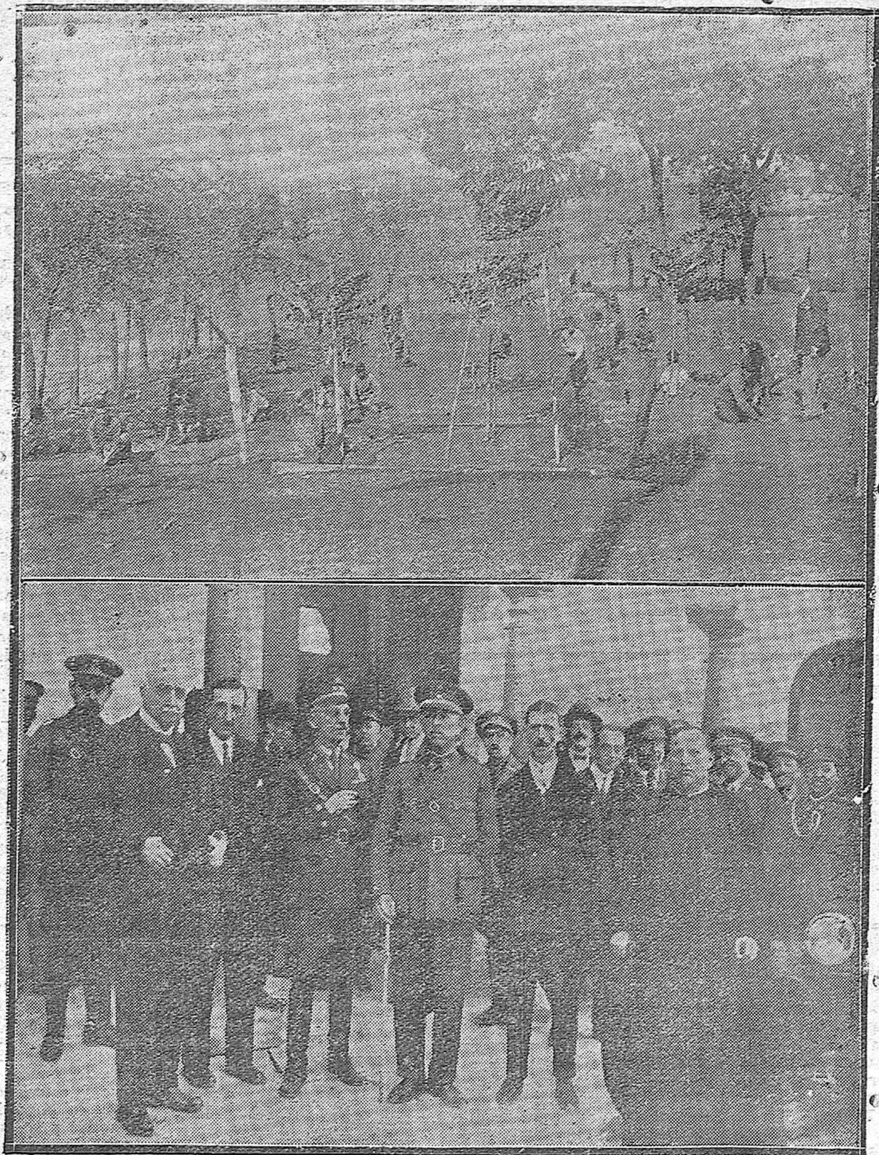
CERRO MURIANO: Pequeño Campo de Experimentación Agrícola que tiene formado el maestro nacional don Felipe Lucena, cuidándolo niños que asisten a aquella escuela nacional.—LUCENA: El General Gobernador señor Cáceres, con el alcalde y otras autoridades después de inaugurar el nuevo cuartel de la Zona de Reclutamiento.