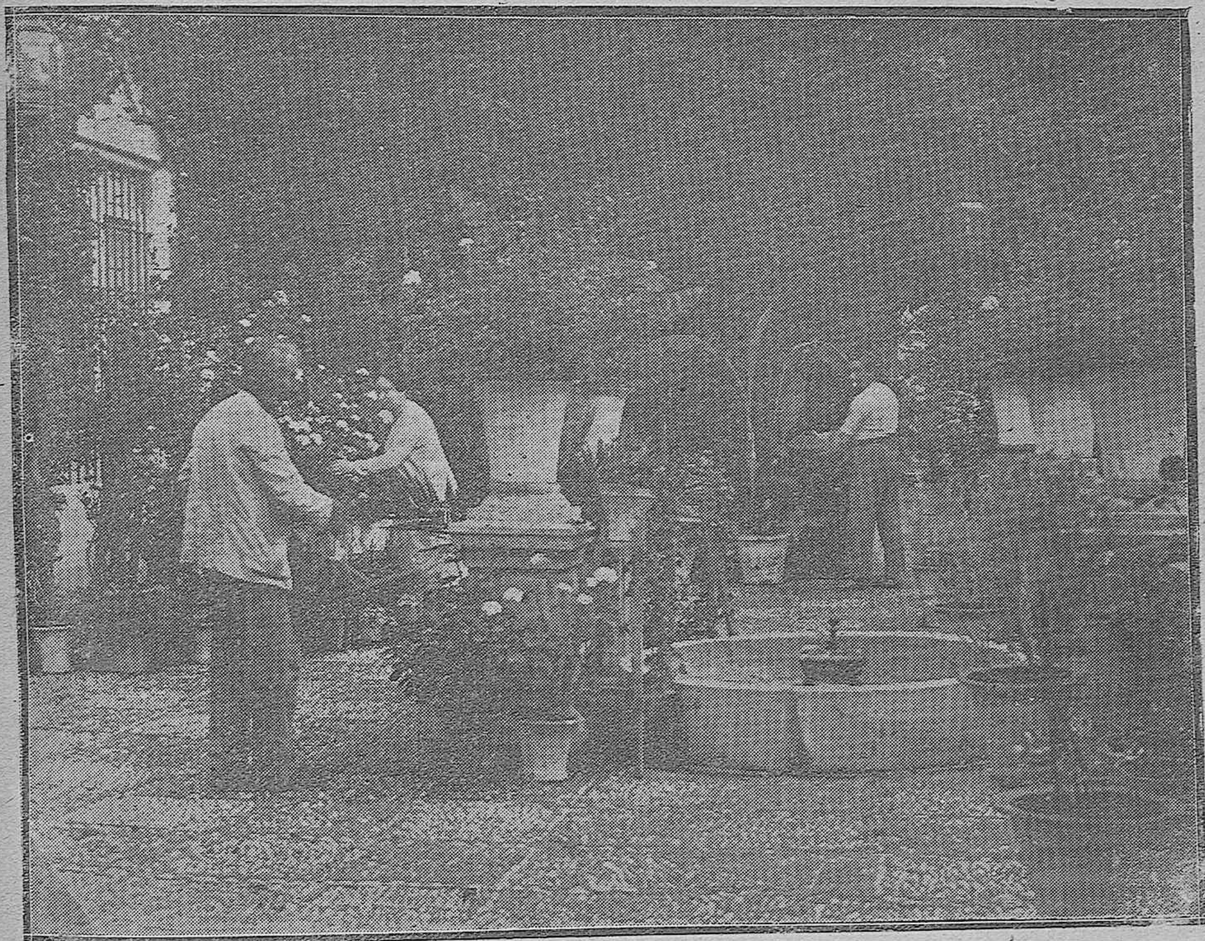
Bellísimo patio de las rejas de Don Gome, que data del siglo XVI, con ligeras modificaciones.