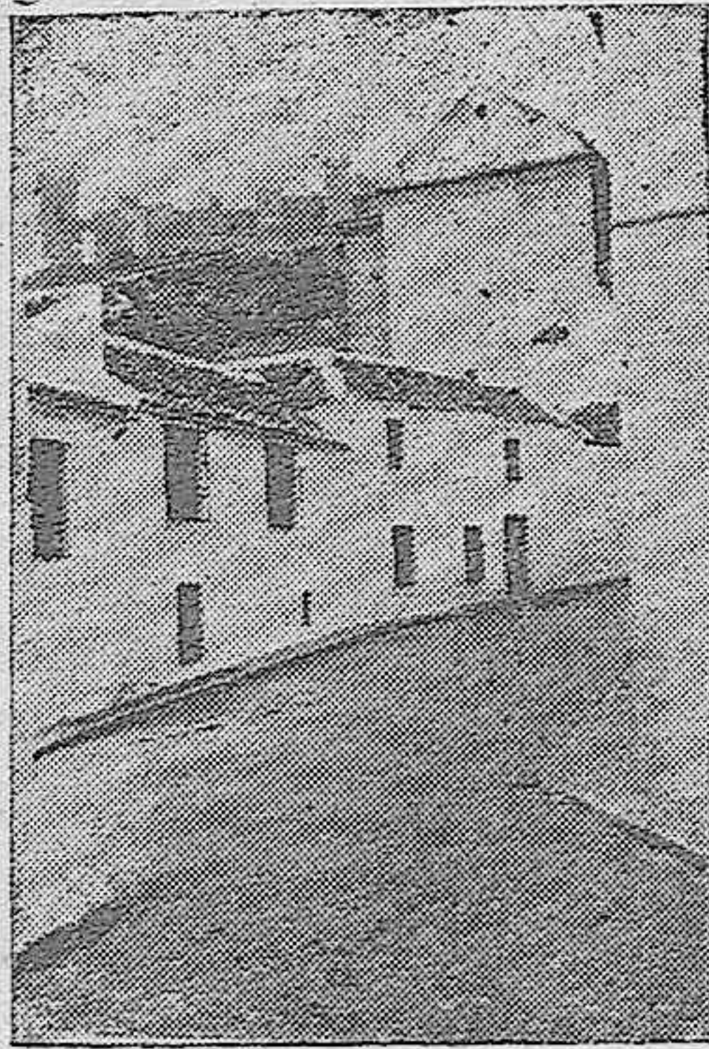
ALMODOVAR DEL RIO.—Una perspectiva del Castillo desde la calle Ramón y Cajal.