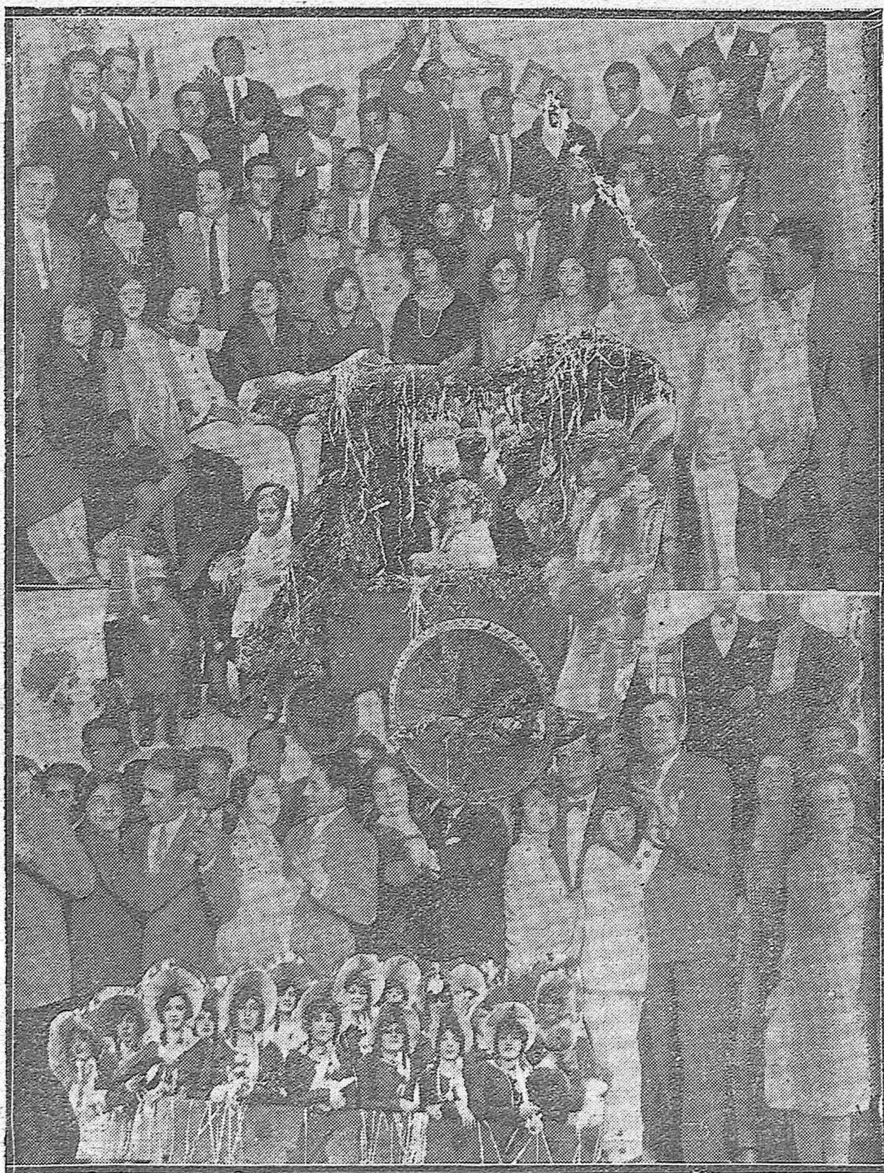
NOTAS FINALES DEL CARNAVAL.—Detalles del baile de máscaras en la Unión Mercantil Recreativa, y carroza de Segadoras que se presentó ayer en la Victoria.— Otro cochecito adornado.