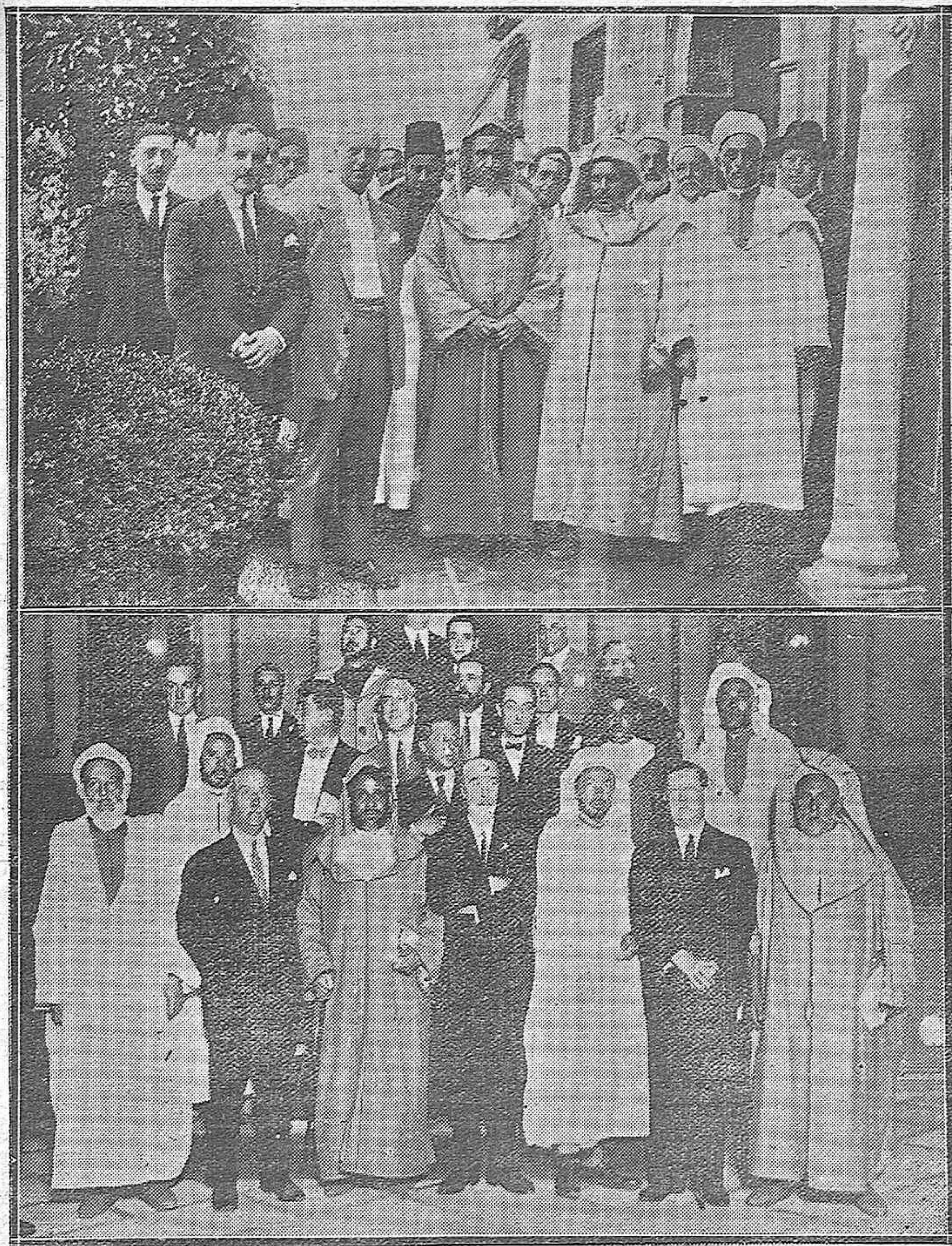
MOROS NOTABLES VISITANDO NUESTRA CIUDAD.—LA COMISIÓN QUE FUE A MADRID CON MOTIVO DEL HOMENAJE AL PRESIDENTE, VISITÓ EL CÍRCULO DE LA AMISTAD, DONDE FUE OBSEQUIADA CON UN TÉ, Y ADMIRÓ LOS MAGNÍFICOS LIENZOS DE NUESTRO MUSEO DE PINTURAS.