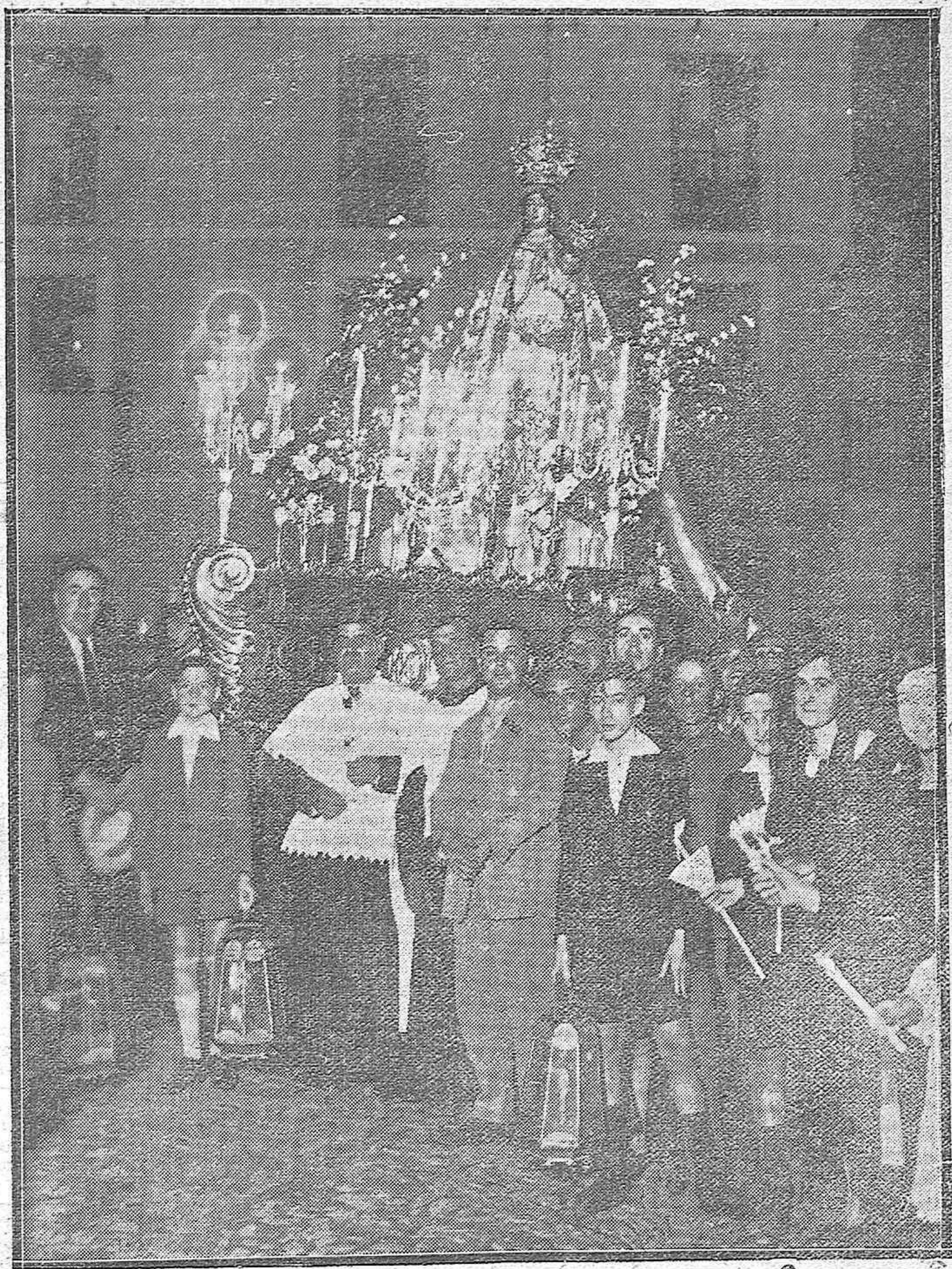
LA PROCESIÓN DE ANOCHE.—LA HERMOSA IMÁGEN DE LA VIRGEN DEL SOCORRO QUE SALIÓ PROCESIONALMENTE DE SU ERMITA PARA DIRIGIRSE A LA PARROQUIA DE SAN PEDRO, ESTRENANDO UNAS MAGNÍFICAS ANDAS CORTADAS POR INNUMERABLES DEVOTOS.