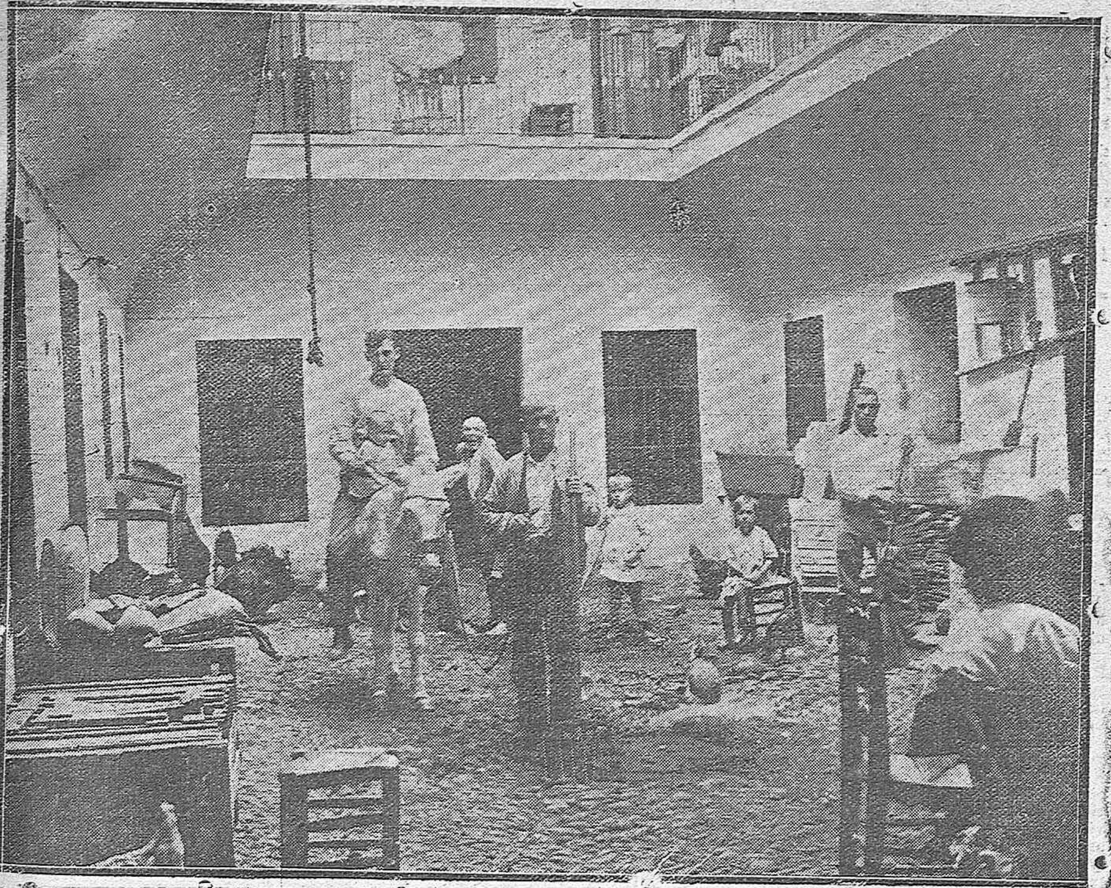
Patío de vecinos de la famosa posada del Sol, en pleno corazón de la Plaza del Mercado.