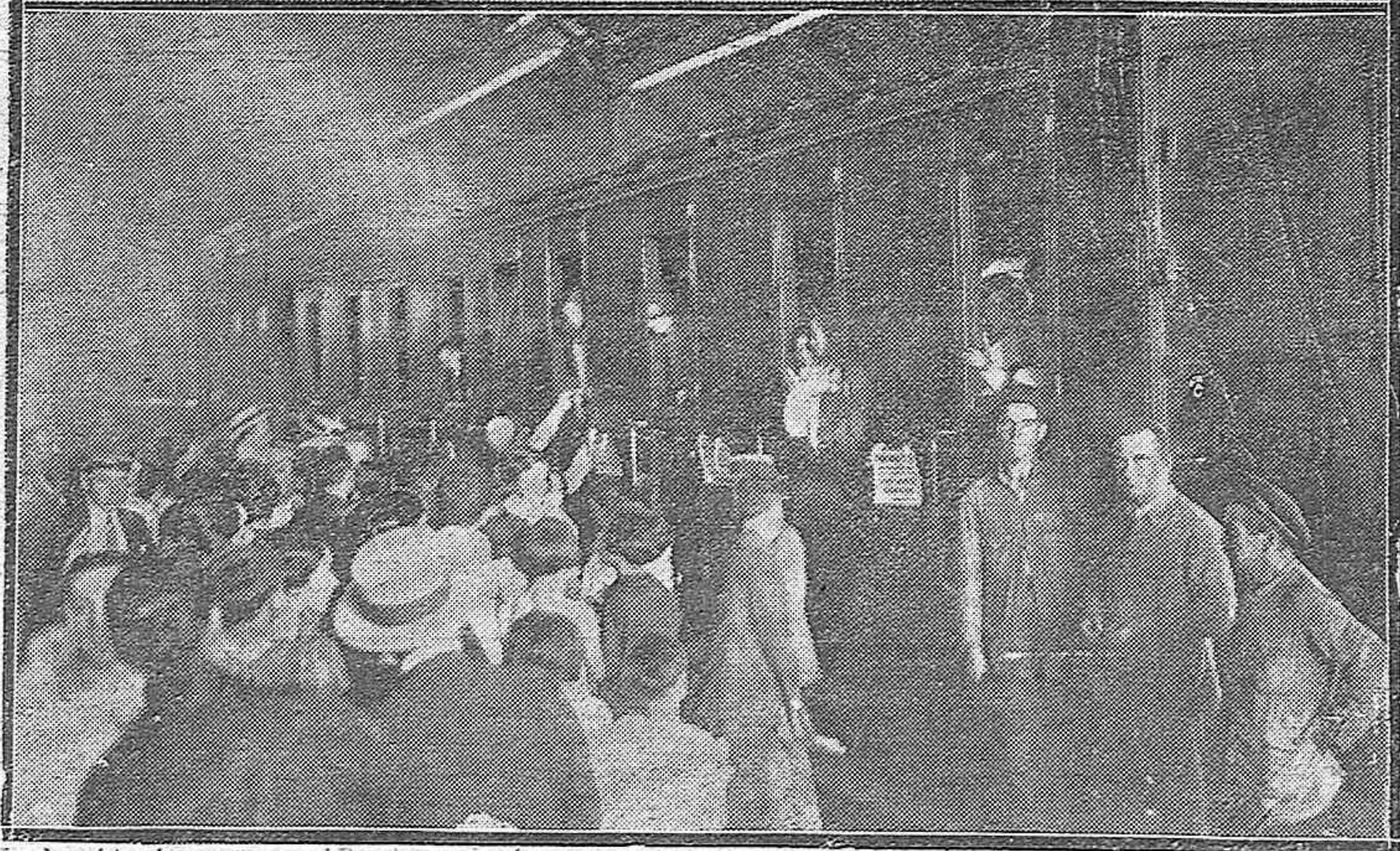
LA SEGUNDA COLONIA ESCOLAR MARÍTIMA. — Grupo de las simpáticas expedicionarias, con sus directores, reunidas en los Jardines de la Agricultura. — En la estación Central esperando la salida para Málaga