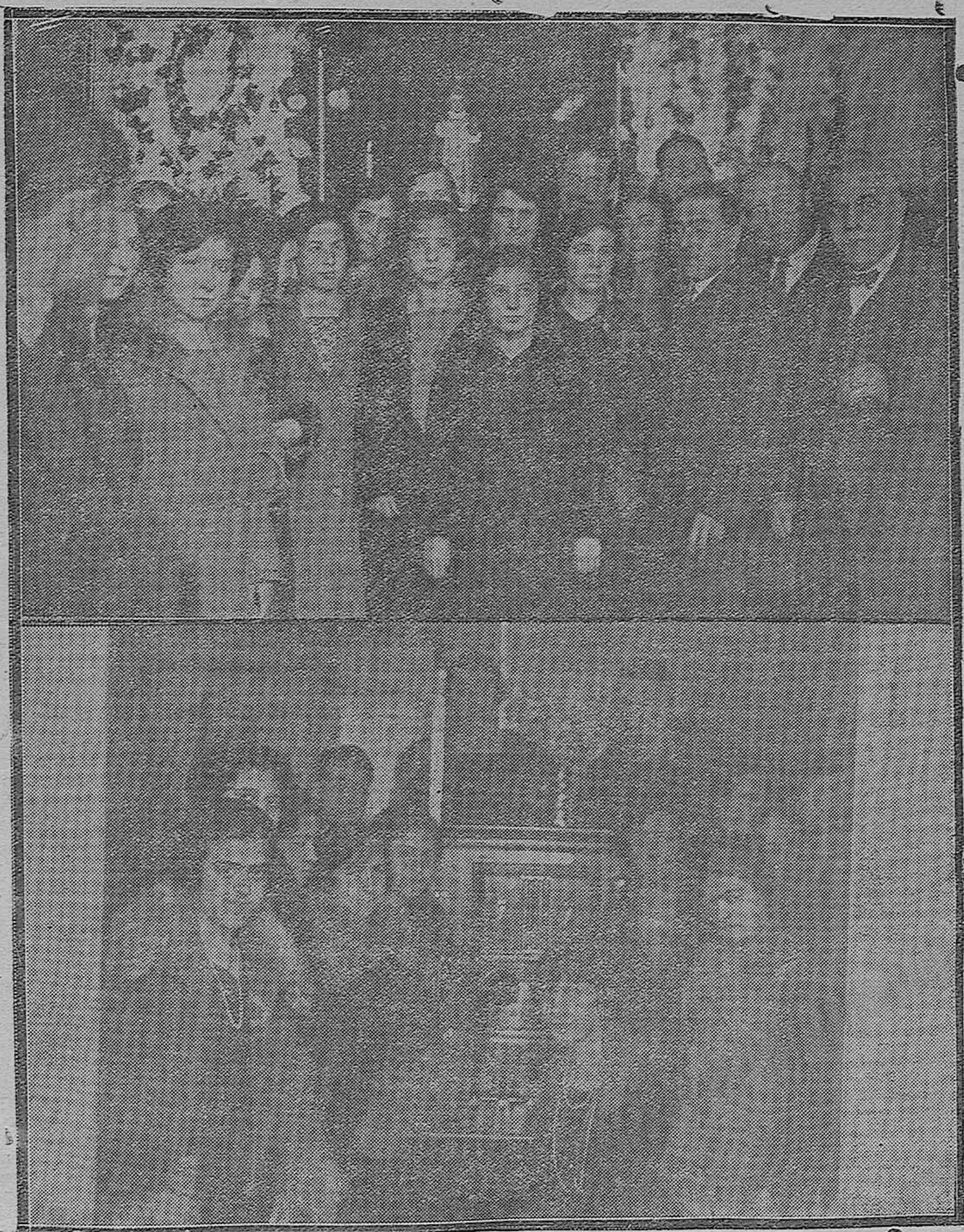
ESPEJO: Inauguración de la Central de Teléfonos: señoritas que asistieron a la bendición del local.—MONTILLA: lindas señoritas telefonistas al lado del Cuadro, después de inaugurado el servicio telefónico en dicho pueblo.