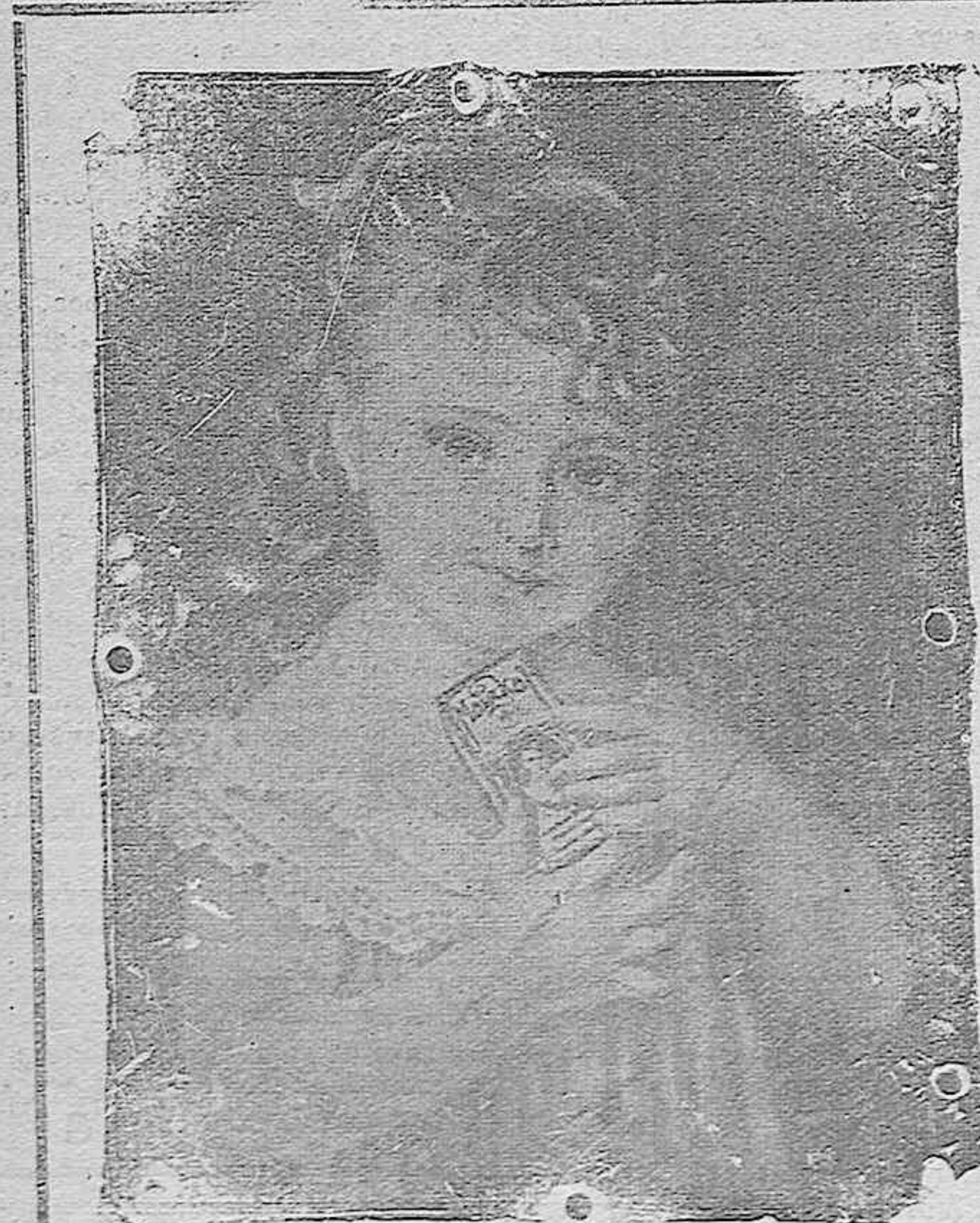
“La niña del Maizkal”