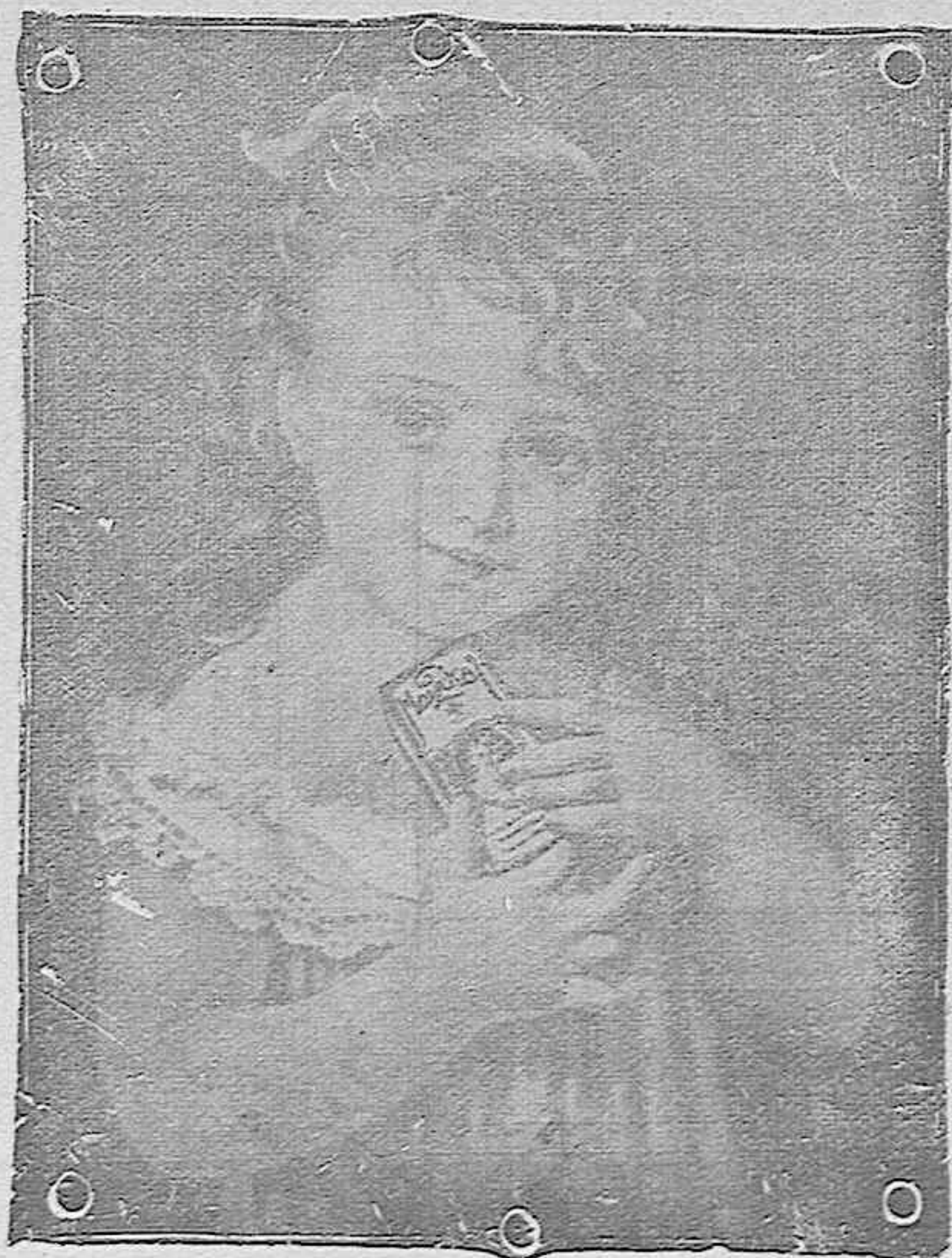
“La niña del Maizkai”