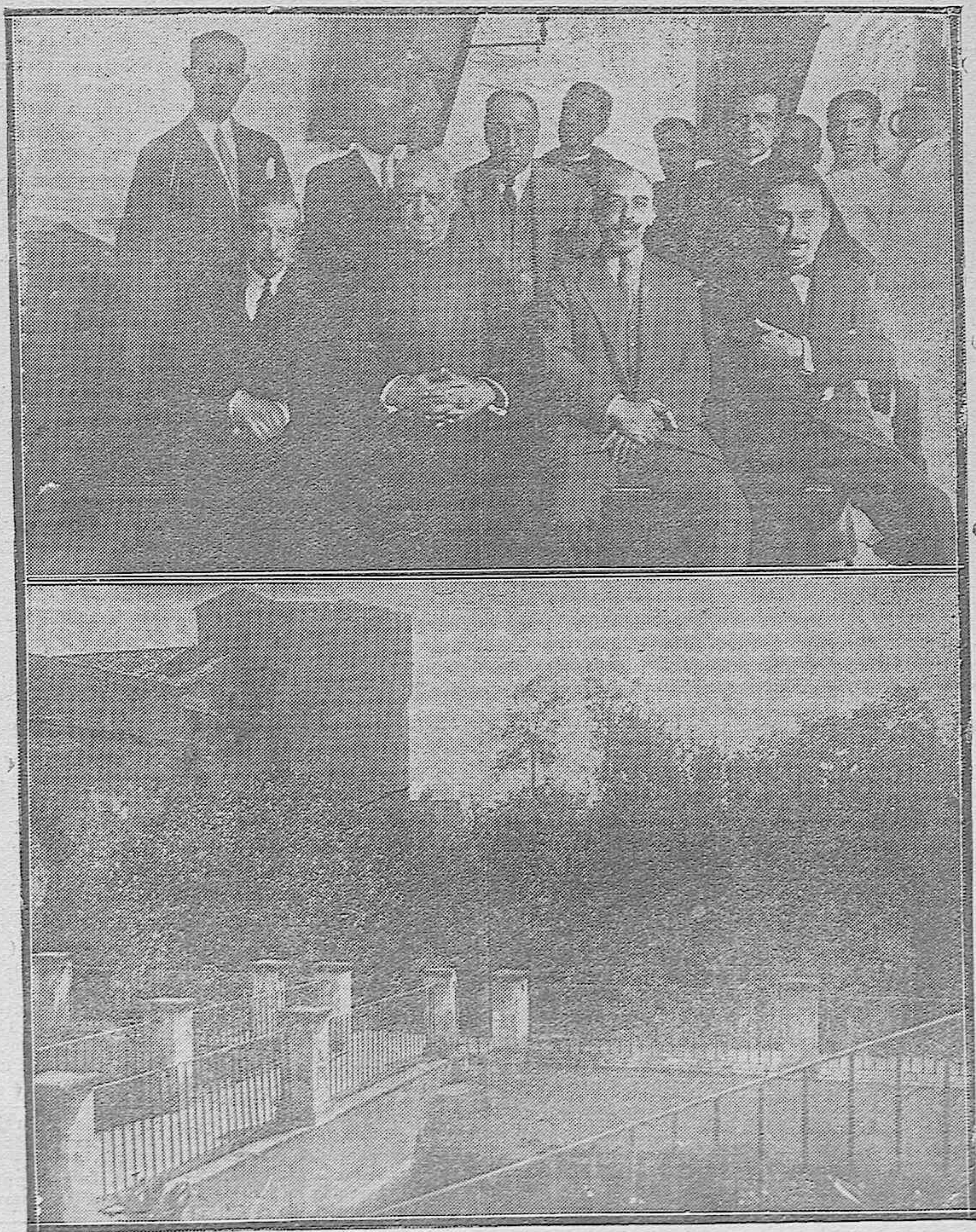
LA FIESTA DEL CUERPO MÉDICO.—La Junta directiva del Colegio Médico al terminar la fiesta que celebraron en honor de los Santos Patronos San Cosme y San Damián, celebrada en la iglesia del Juramento.—Un aspecto del jardín del Alcázar.