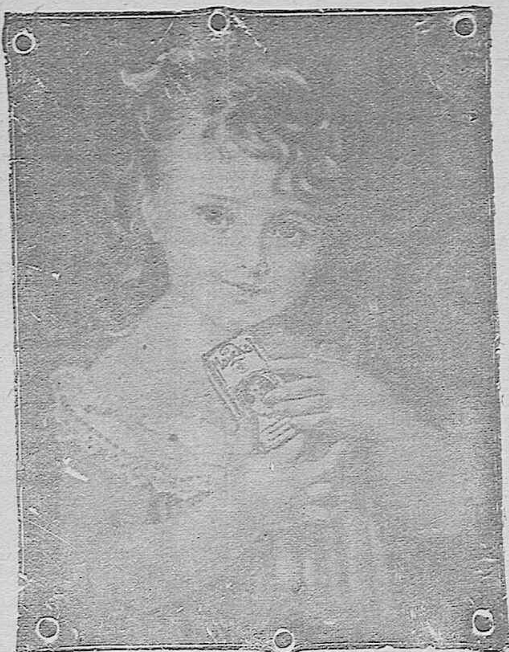
“La niña del Maizkal”