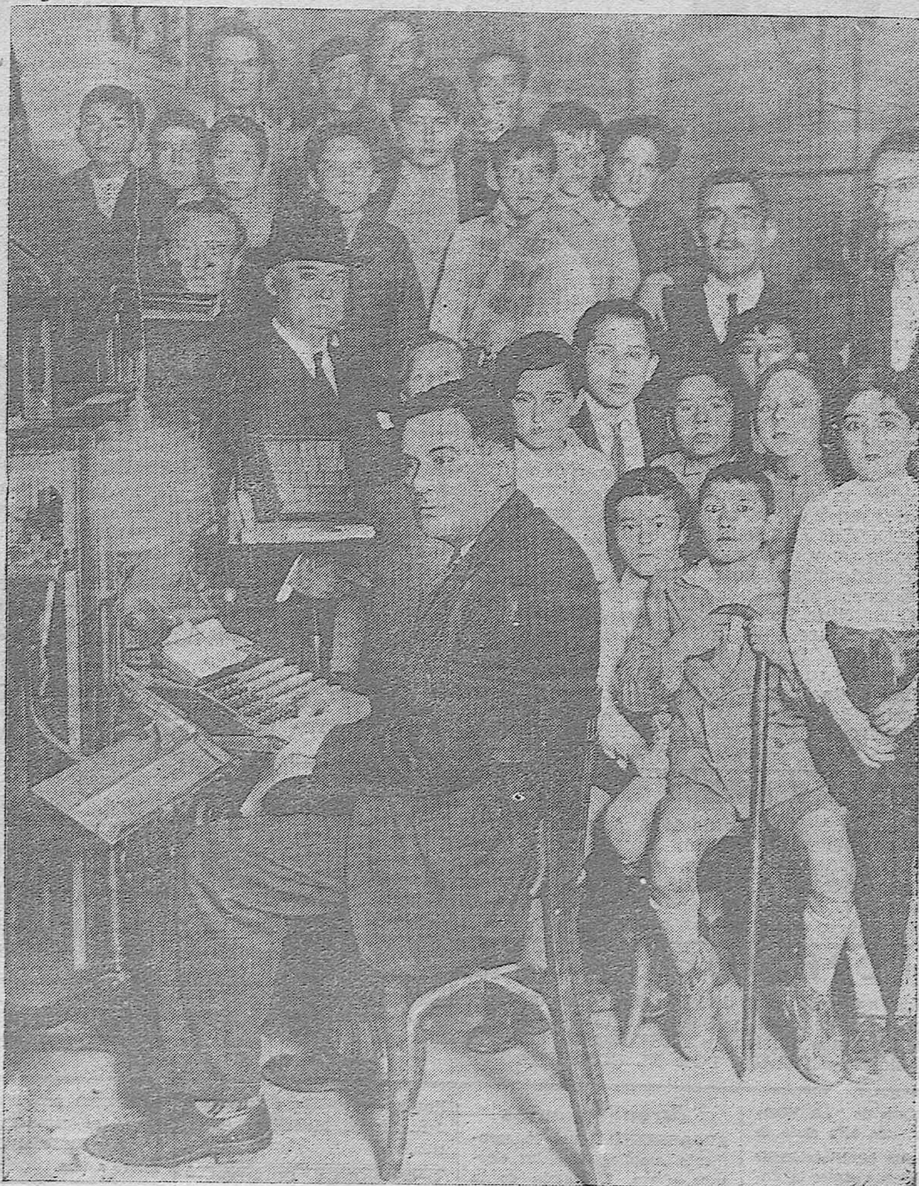
Profesores de la Escuela Graduada López Diéguez, con un grupo de sus alumnos que visitaron ayer LA VOZ, presenciando el funcionamiento de una "Linotypia"