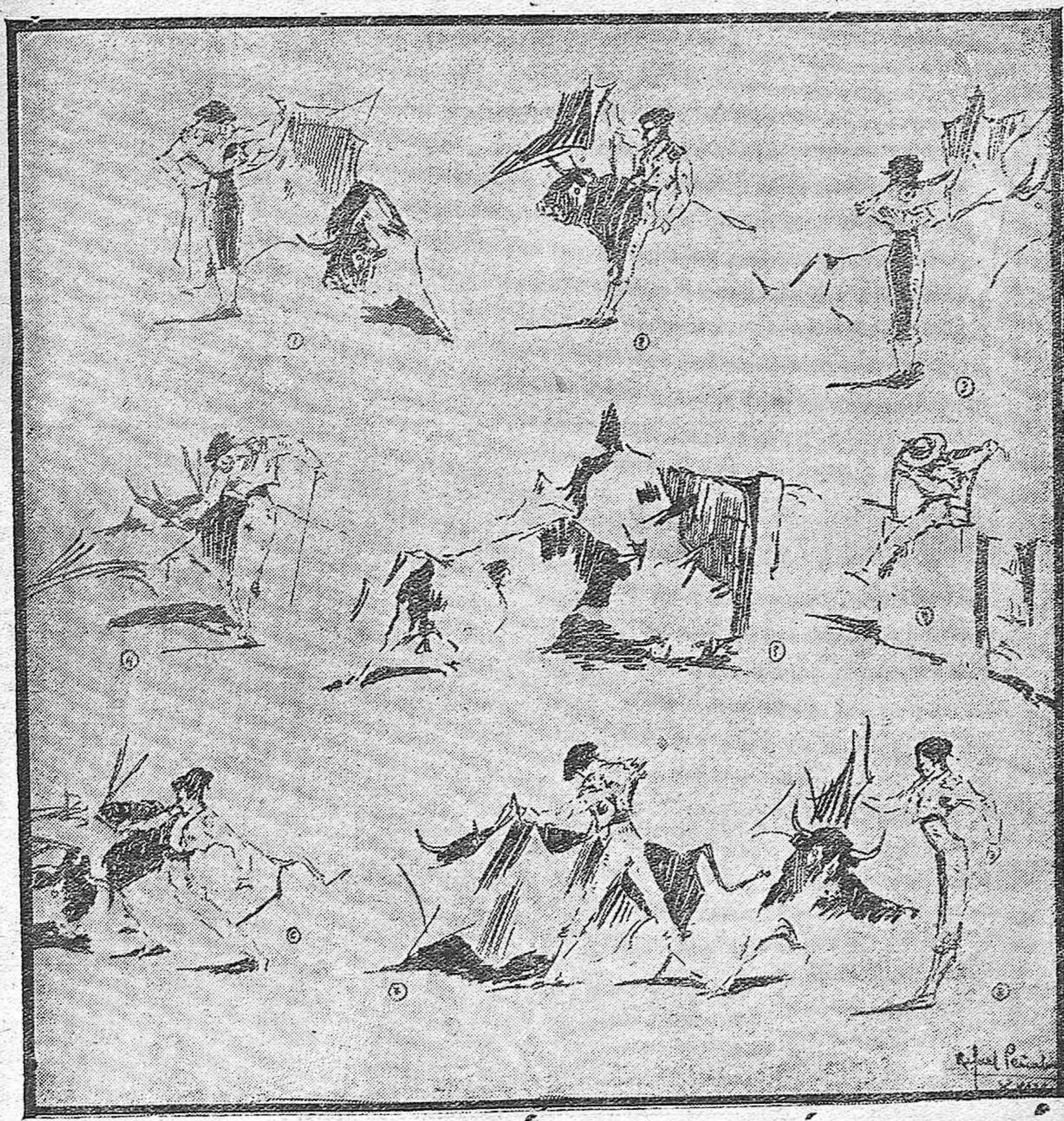
1, 2, 3, 4) Pérez Soto en su segundo novillo.---5) El toro cuarlo recargando con poder al caballo de un picador a la salida del chiquero.---6) Dejmonte en un muletazo medio de rodillas.---7, 8) Matías García en su primero.---9) La nota cómica de la corrida; apuntes al natural por Rafael Peñalver.