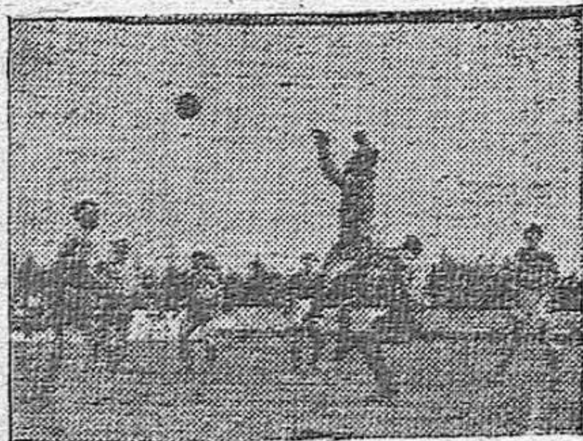
Una intervención acertada de Ladrón de Guevara en el partido del domingo frente al Betis.

Jugó casi todo el partido con diez jugadores