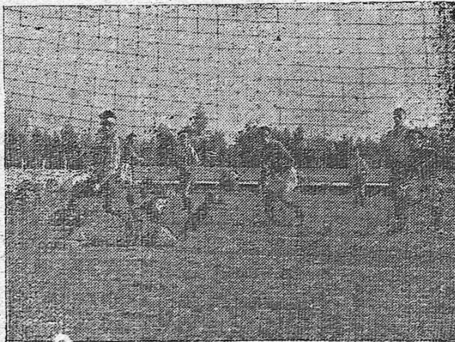
El tercer gol del Betis. Ladrón en el suelo y Guillermo en busca del balón para meterse con él en la red.

A los veinticinco minutos de esta segunda parte, agotado el Rácing por el esfuer-