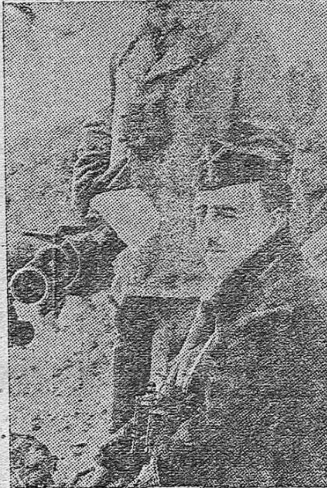
El Caudillo dirigió personalmente las resonantes batallas victoriosas del Ejército nacional

En el año de 1920, fué creado el glorioso