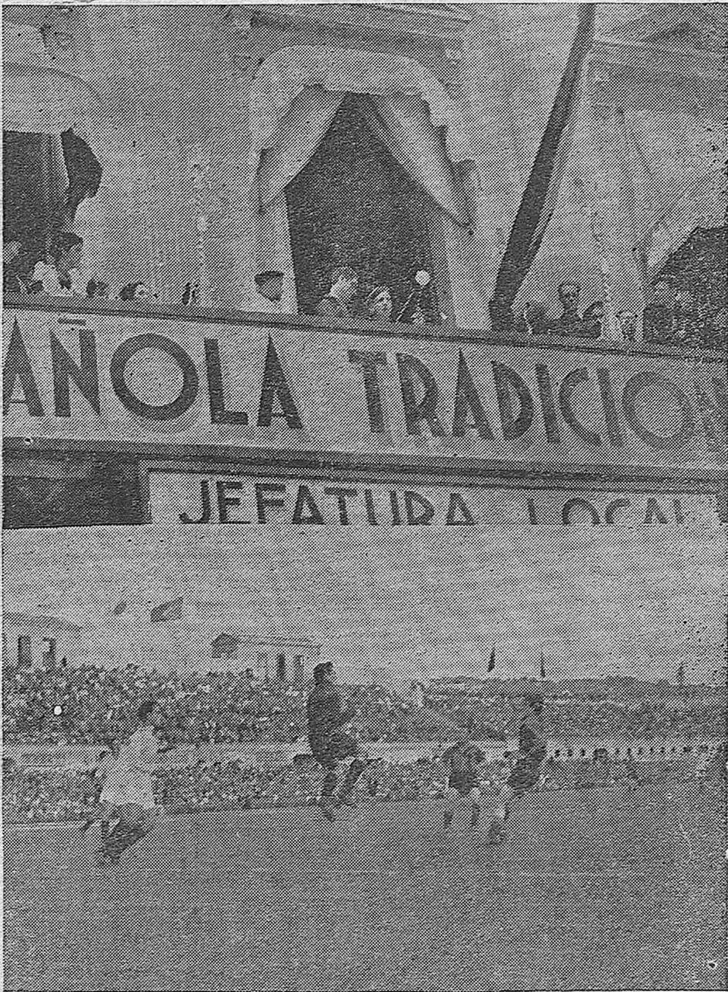
REUS.—El Vicesecretario del Movimiento, camarada Fanjul, en el balcón de la Jefatura local de Falange, presenciando el desfile de las organizaciones de la misma.—BARCELONA: Una buena parada del guardamenta del Sevilla F. C. durante el partido final del torneo «Copa del Generalísimo», ganado por el Sevilla sobre el Racing de El Ferrol.