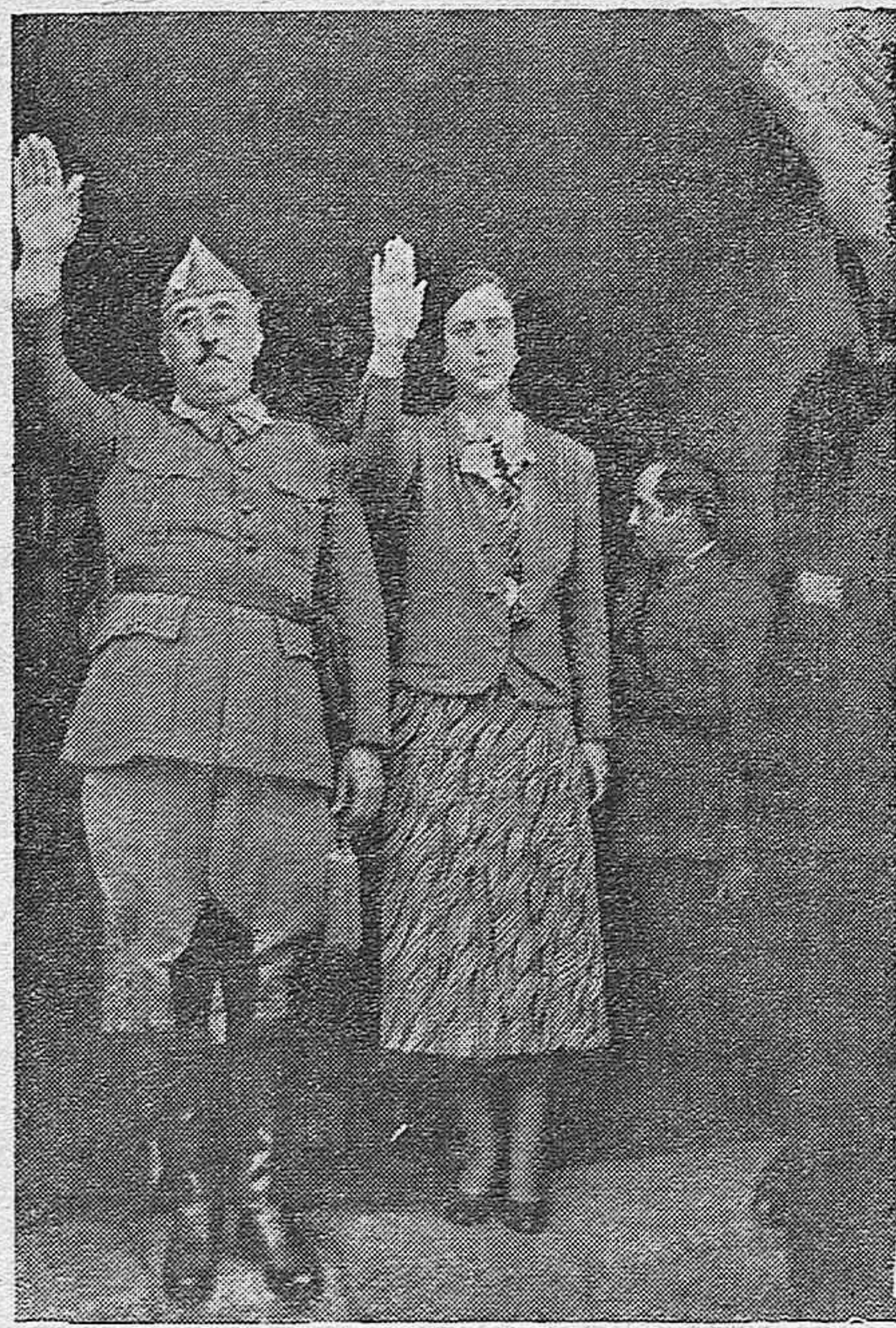
EL CAUDILLO EN GALICIA.—Una de las etapas del viaje triunfal del Caudillo por Galicia, ha sido la visita al humilde pueblo pesquero de Cayón.—El Generalísimo y su esposa saliendo de la Casa Ayuntamiento.