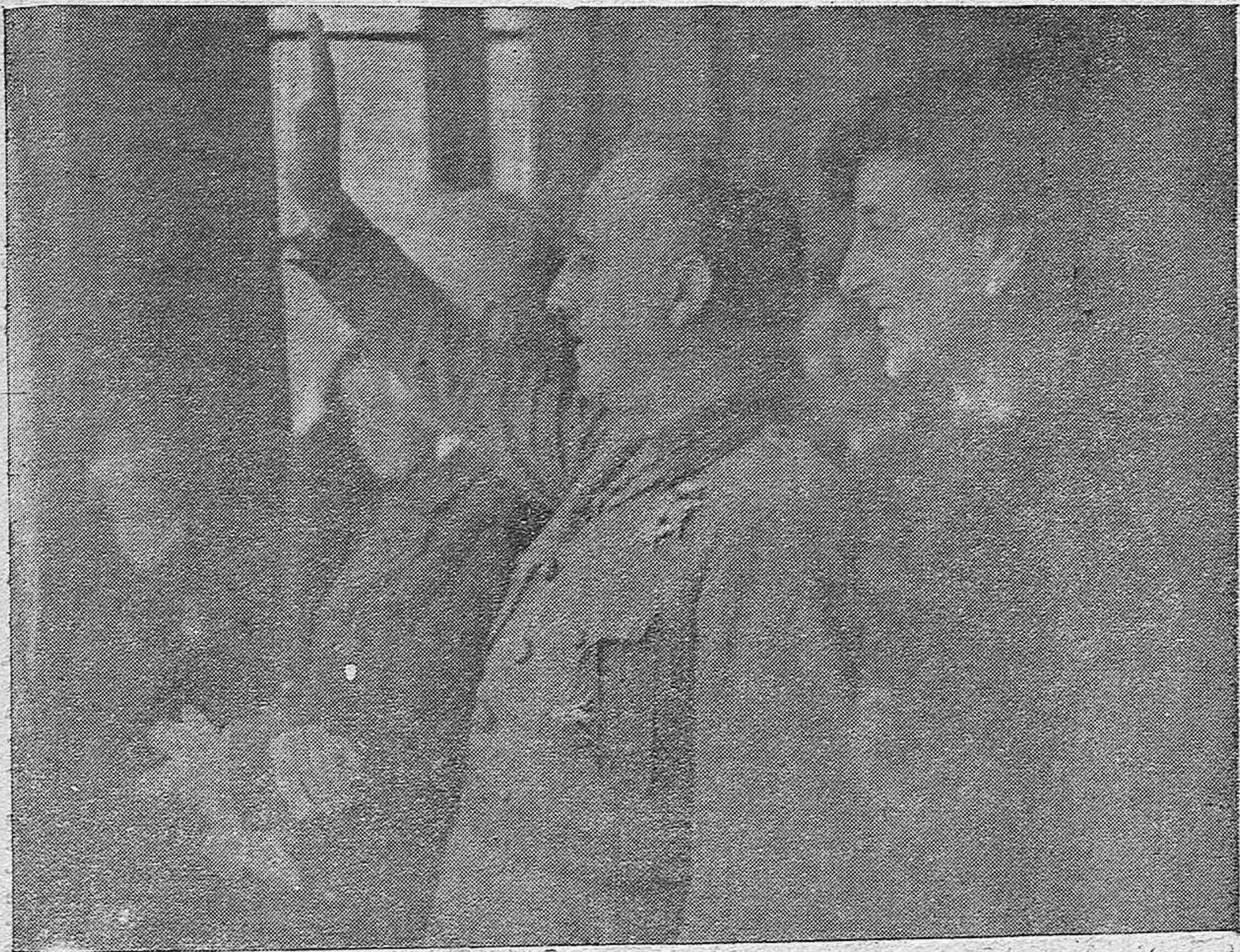
El Caudillo y su esposa presenciando desde el Club Nautico, el desfile de la flota pesquera. El Generalísimo, lleva la Medalla de Oro de la ciudad, que le ha sido concedida por el Ayuntamiento de La Coruña