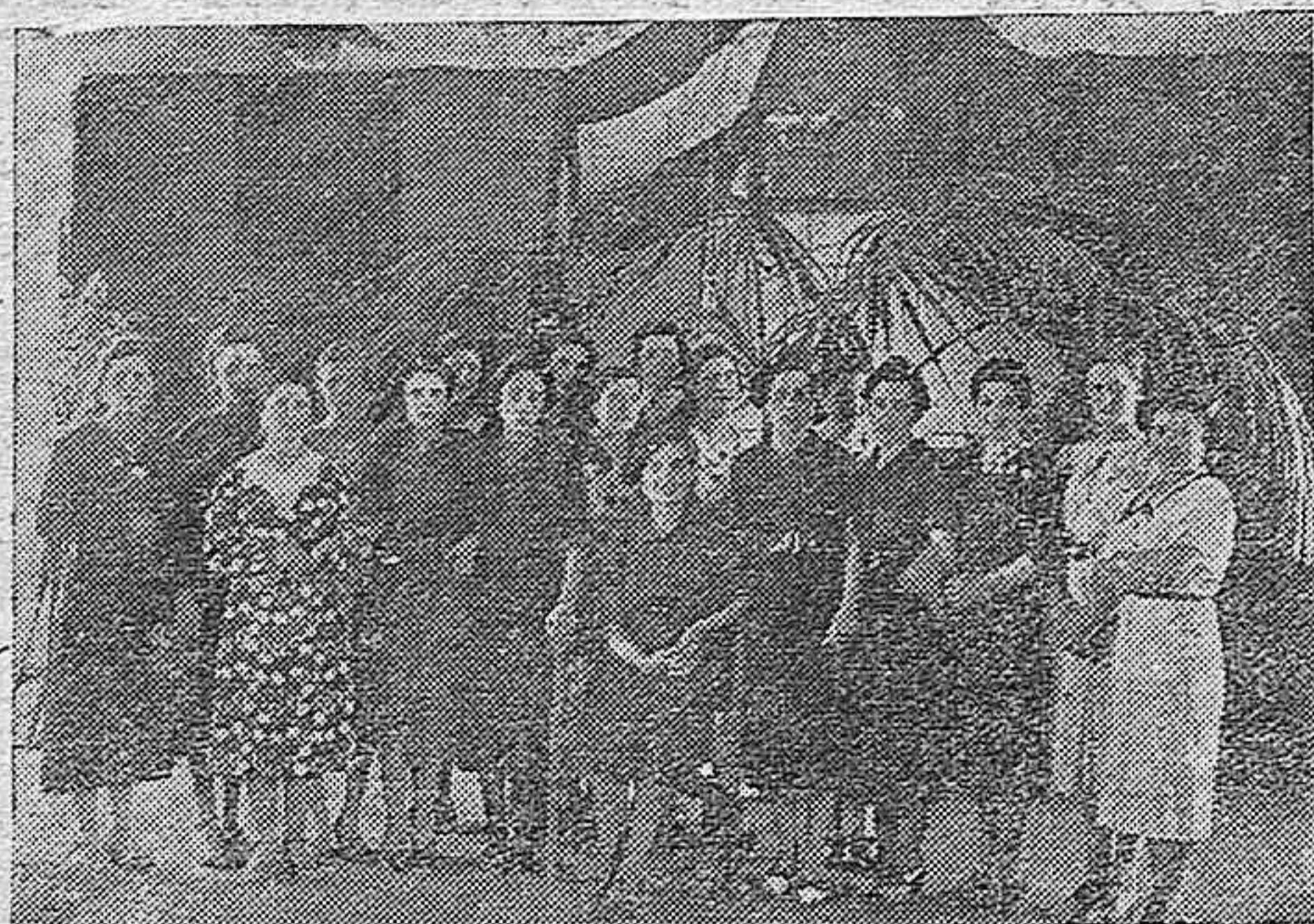
Nuestras camaradas de la Sección Femenina de La Guijarrosa.