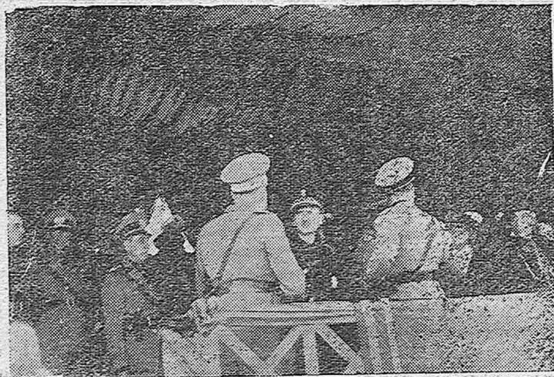
El señor Serrano Suárez, el Conde Ciano (de espaldas) y otras jerarquías italianas en la tribuna desde la que presenciaron el desfile de las fuerzas españolas e italianas.