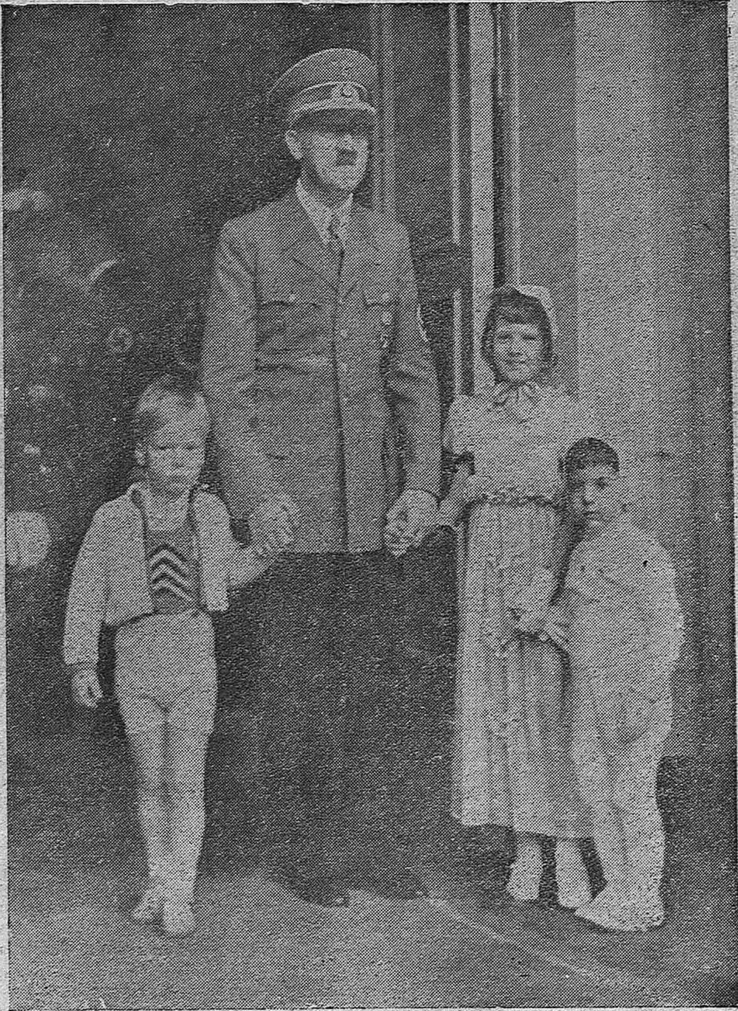
En el 50 aniversario del nacimiento del Führer, en la entrada de la Cancillería, los niños alemanes saludaron y felicitaron a Hitler.