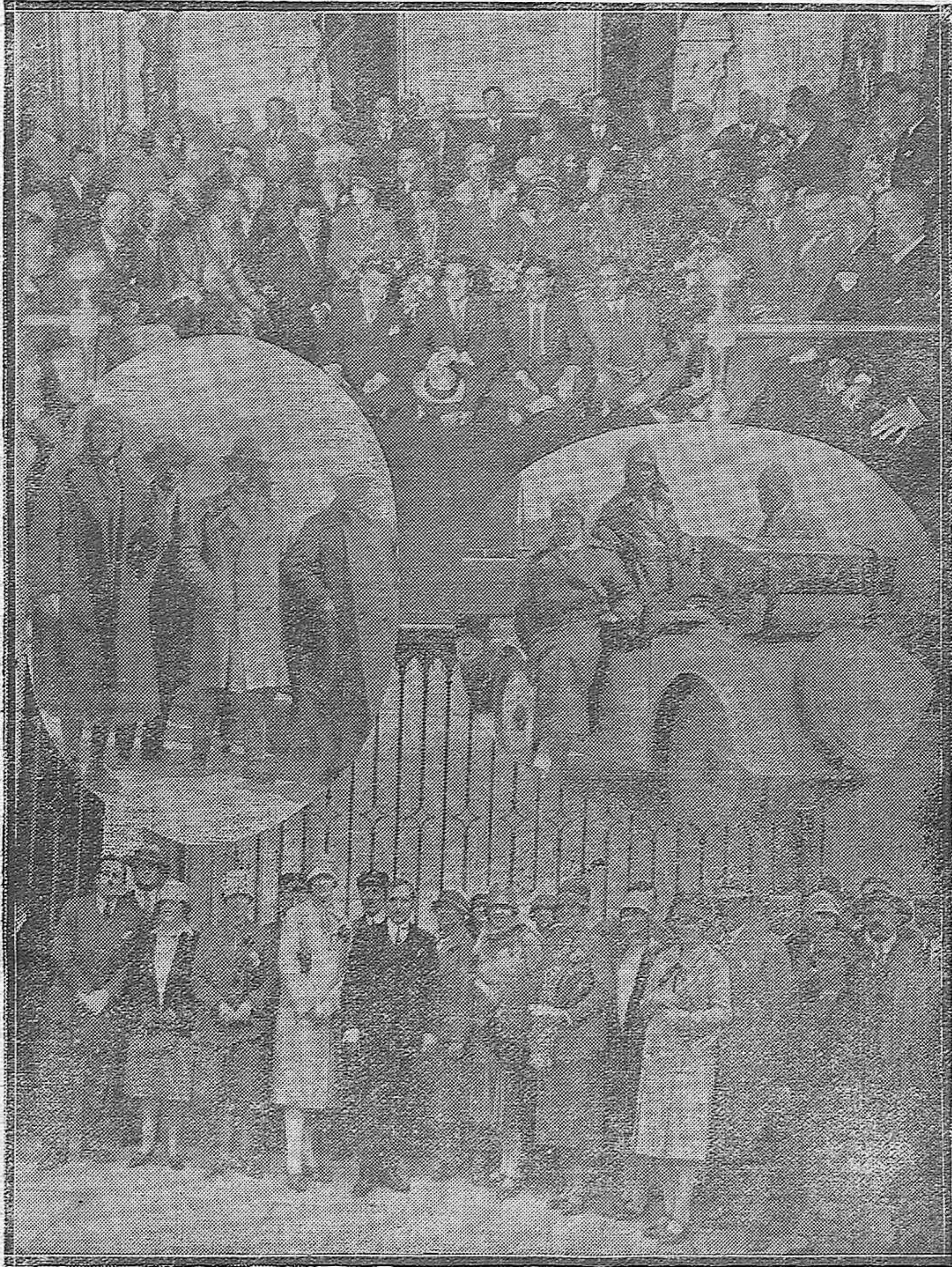
Varios momentos interesantes de la visita que han hecho a nuestra ciudad los turistas bávaros y en cuyo honor se celebró una recepción en el Ayuntamiento.