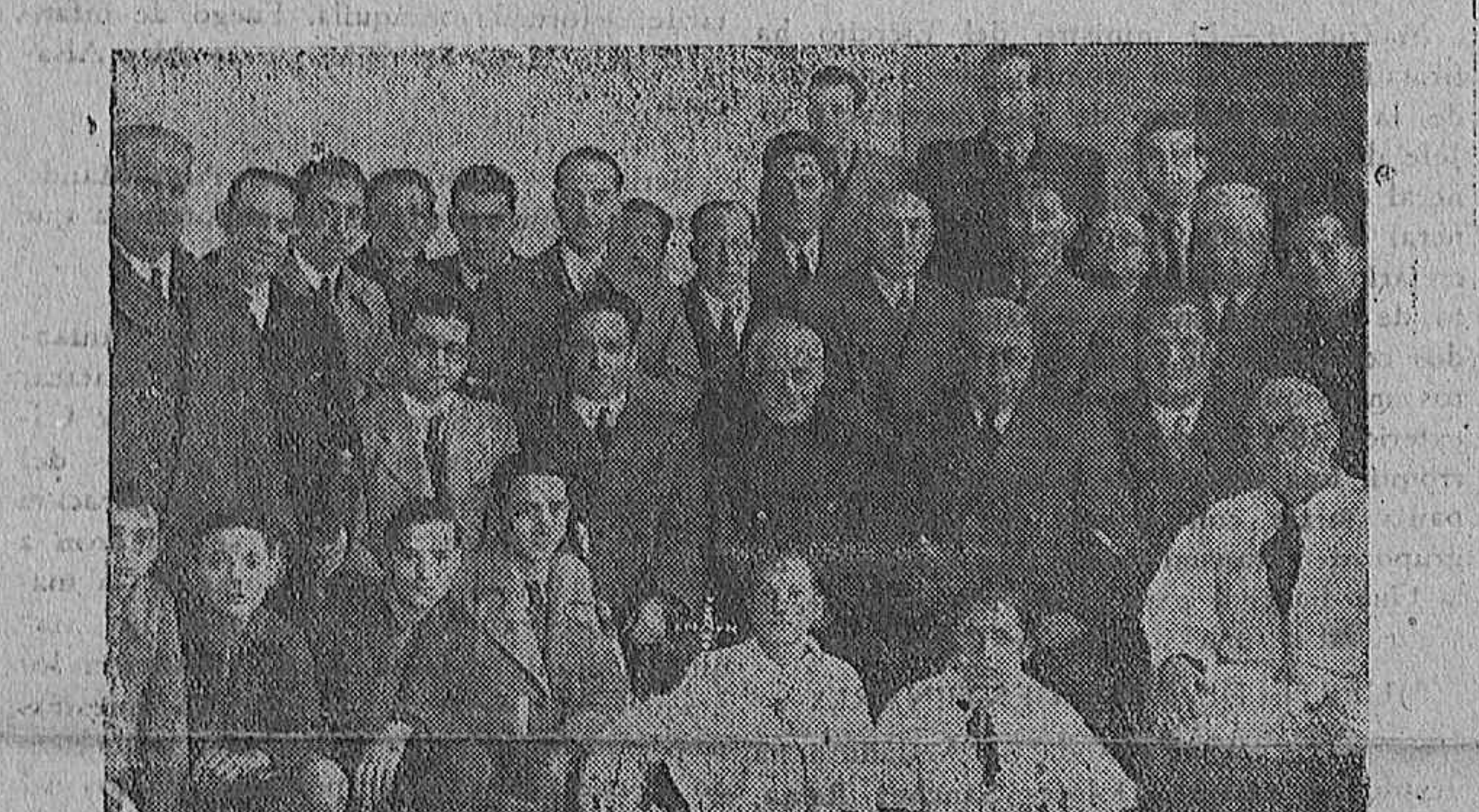
El día dos, celebró el Comercio cordobés su anual fiesta religiosa en honor de su Patrona la Virgen de la Candelaria.—Grupo de concurrentes a la función en la Iglesia de San Rábalo