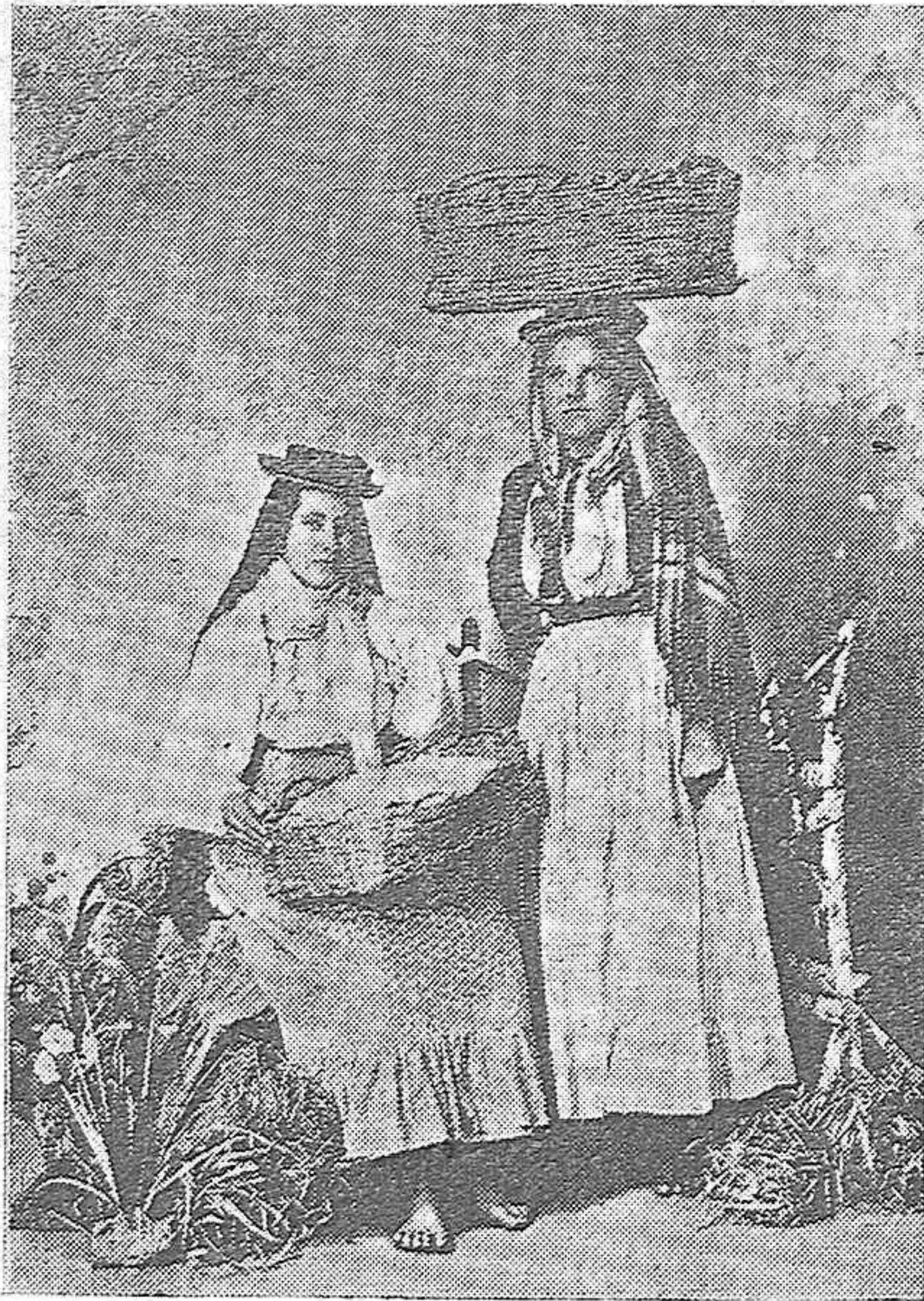
DOS INTERESANTES TIPOS DE MUJER DE LAS ISLAS CANARIAS. LLEVANDO SU MERCANCÍA SOBRE EL DURO Y TÍPICO SOMBRERO DE FIELTRO Y RAFIA.

Rogamos encarecidamente a nuestros amables comunicantes que firmen sus escritos, o le estampen un sello que nos garantice la autenticidad de los mismos.