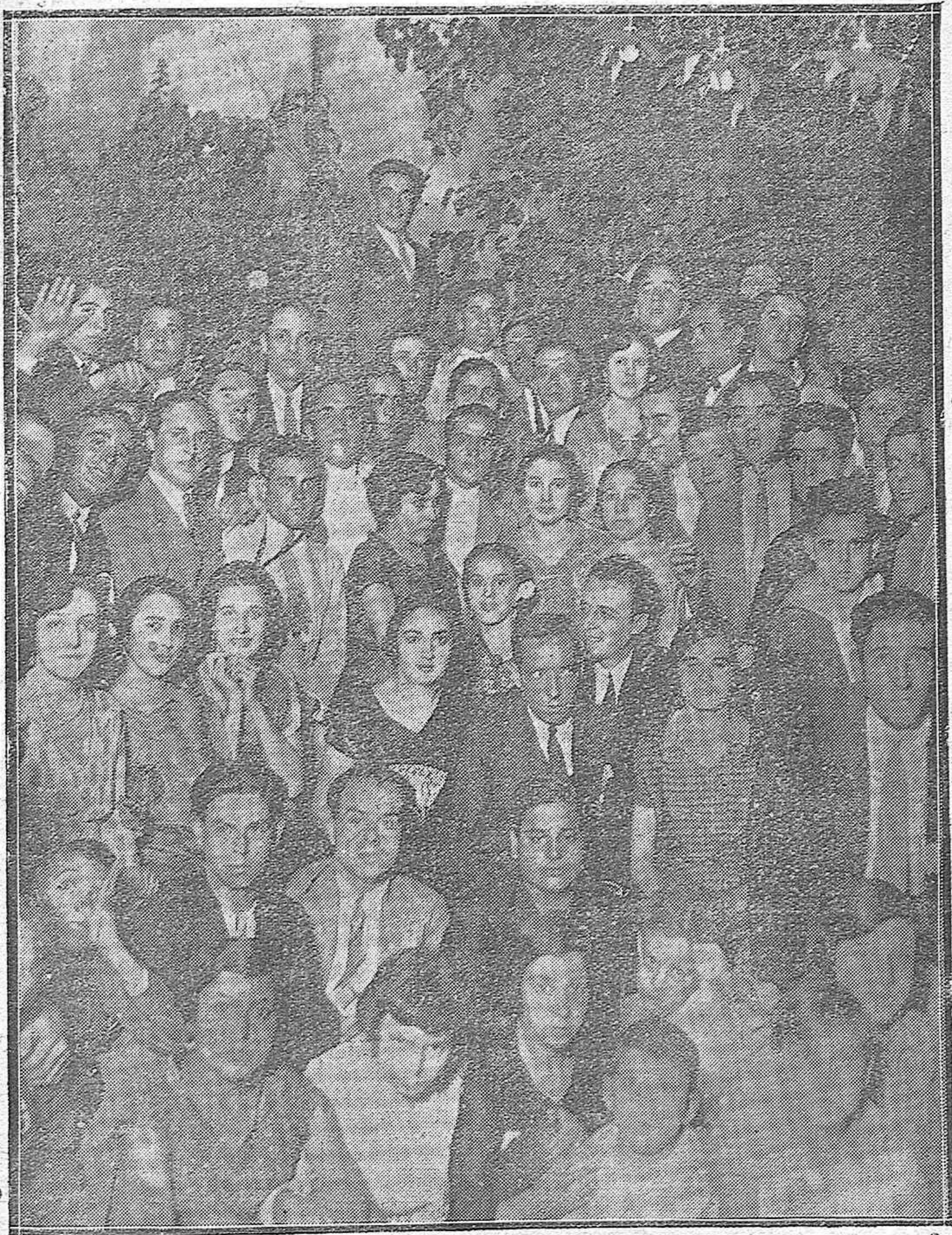
LAS ÚLTIMAS VERBENAS CORDOBESAS. —EN LA PLAZA DE SAN PEDRO SE CELEBRÓ NOCHES PASADAS UNA ANIMADÍSIMA VERBENA.—PRIMOROSAS MUCHACHAS DEL BARRIO; COMPASES DE PIANILLO, PAREJITAS DE TÓRTOLOS, Y TODO BAJO UN EMPARRADO DE FAROLILLOS DE COLORES, ALEGRES Y LUMINOSOS COMO LA JUVENTUD VERBENERA, QUE BORDA UN PASODOBLE SOBRE LA ARENA DEL PATIO FAMILIAR.