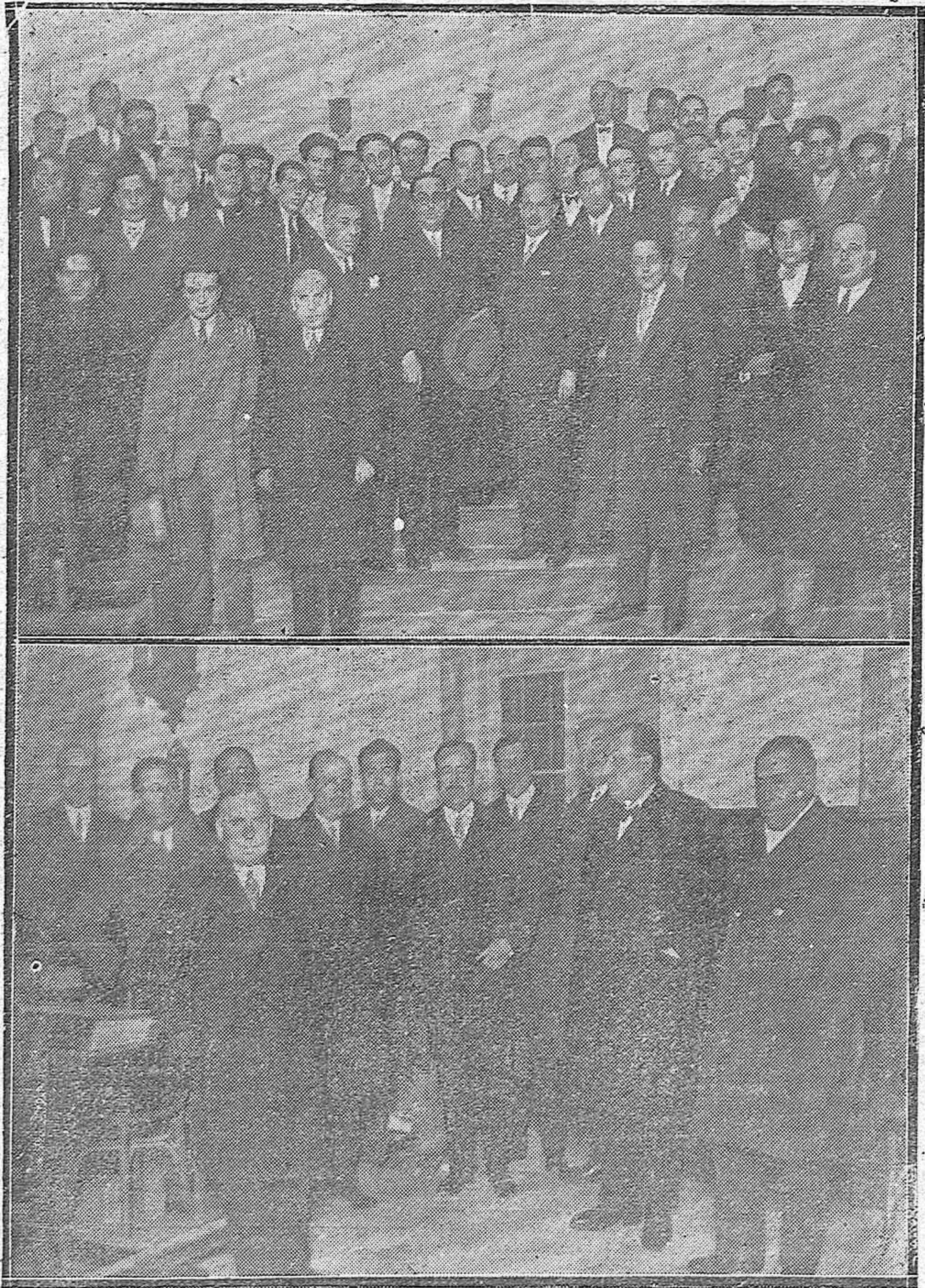
CELEBRACIÓN DEL SEGUNDO ANIVERSARIO DE LA CREACIÓN CORPORATIVA PARITARIA.-Los DELEGADOS DE LOS COMITÉS PARITARIOS, CON ALGUNOS VOCALES Y OBREROS, AL TERMINAR EL IMPORTANTE ACTO CONMEMORATIVO CELEBRADO EN NUESTRO INSTITUTO.-LOS PRESIDENTES DE DICHS COMITÉS Y PERSONALIDADES QUE INTERVINIERON EN EL ACTO.