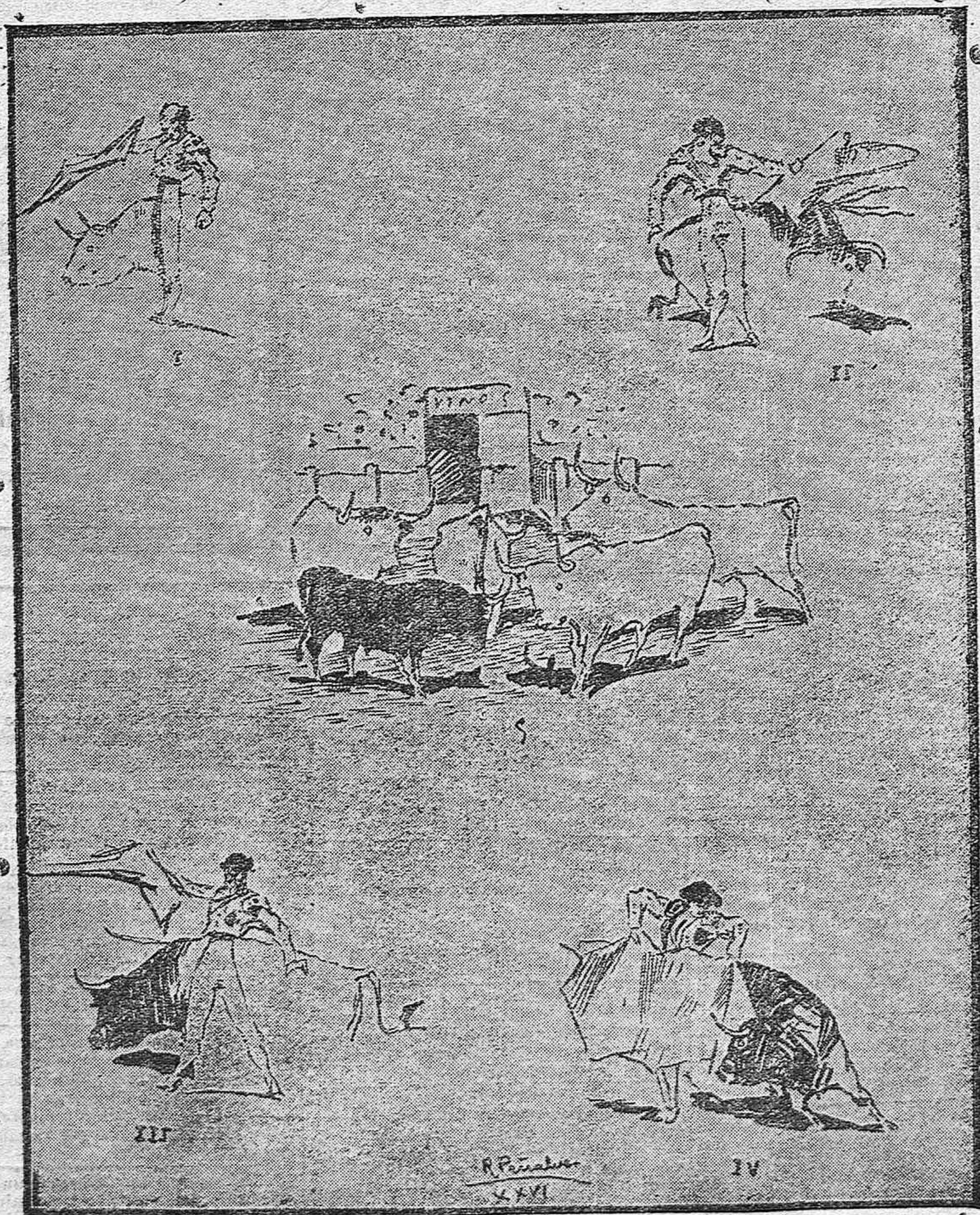
De la corrida de toros de Feria.—1) Gallo, (2) Belmonte, (3) Algabeño, (4) Zurito.—5) El chico acercando toro camino de los corrales, por chico. (Apuntes tomados del natural por Rafael Peñalver.)